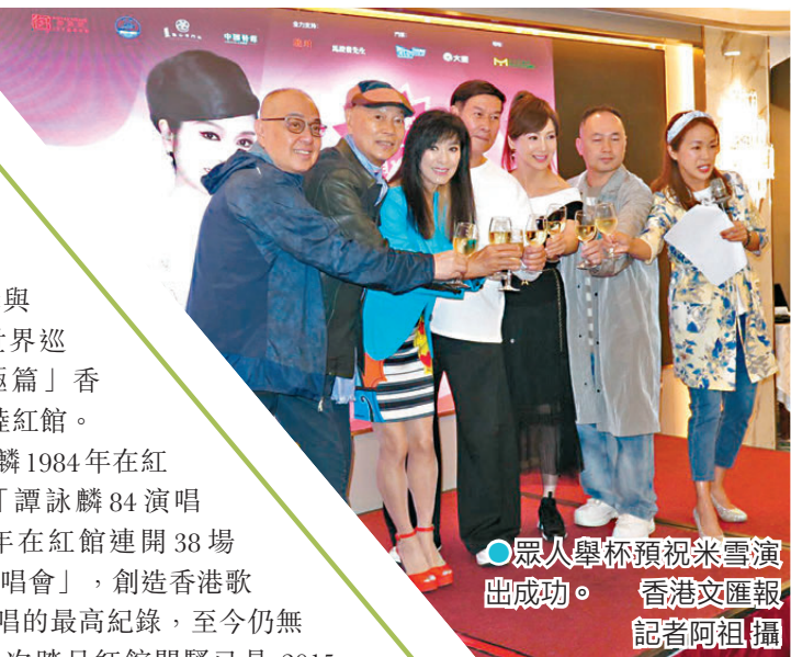
●眾人舉杯預祝米雪演出成功。

此外，演唱會海報設計亦別具心思，復刻1984年紅館首個個唱「譚詠麟84演唱會」及1994年克服萬難在大球場舉行的「譚詠麟94年純金曲演唱會」兩大里程碑演唱會的經典元素，既見證其輝煌的演藝歷程，更是一份與歌迷超越時間的情感延續。