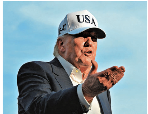
●特朗普警告伊朗若不迅速提出更好的協議方案，將遭受更猛烈打擊。

伊朗武裝部隊發言人18日警告美方，不要對伊朗發起新的軍事行動。巴加埃當天稱，在巴基斯坦斡旋下，伊美仍保持對話，但強調伊方不會把涉及伊朗權益的問題拿來談判或妥協。根據《不擴散核武器條約》，伊朗和平利用核能的權利已獲承認，無需任何個人或第三方再予以承認。巴加埃也回應特朗普的威脅，稱「不必擔心，我們知道如何應對」。