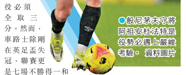
●般尼茅夫守將阿祖安杜法特是役勢必遇上嚴峻考驗。

同日另一場比賽車路士主場對熱刺(Now623台周三3:15a.m.直播)。車路士目前少賽一場下，落後第七位白禮頓(歐霸席位)四分，以及落後第八位賓福特(歐協聯席位)三分，如球隊想取得歐戰資格增加收入，是役必須全取三分。然而，車路士除剛在英足盃失冠，聯賽更是七場不勝得一和六負，狀態明顯無復舊觀。