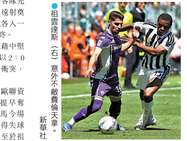
●祖雲達斯(右)意外不敵費倫天拿。

科木趕上。由於科木本季聯賽兩度擊敗祖記，憑對賽成績佔優升上第五，「祖記」則從第三名暴跌至第六，痛失爭四主動權，來季歐聯席位危在旦夕。