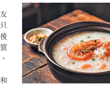
●海鮮砂鍋粥

最近，偶然在香港仔吃了一碗牛肉粿條，湯裏的牛肉鮮嫩足量，湯底清甜不膩，粿條上撒着炸得金黃酥脆的蒜頭酥和提味的芹菜粒。一口湯頭入肚，竟勾起了這一篇滿腹的食慾與情緒。