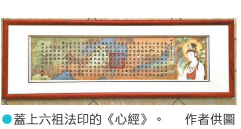
●蓋上六祖法印的《心經》。

到了現在這個數字時代，殘缺的美不但沒退場，還換了一副新樣子。故宮修《千里江山圖》的時候，沒有把那些歲月的痕跡全抹掉，反而讓它們跟現代科技好好相處。有些 NFT 數字藝術，甚至故意在作品裏留下殘缺的痕跡，好像在跟我們說：「就算活在虛擬世界裏，真正動人的東西，依然離不開這些不完美的溫度。」殘缺，就這樣成了連接過去和現在的一座橋。