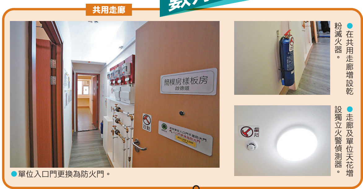
●單位入口門更換為防火門。