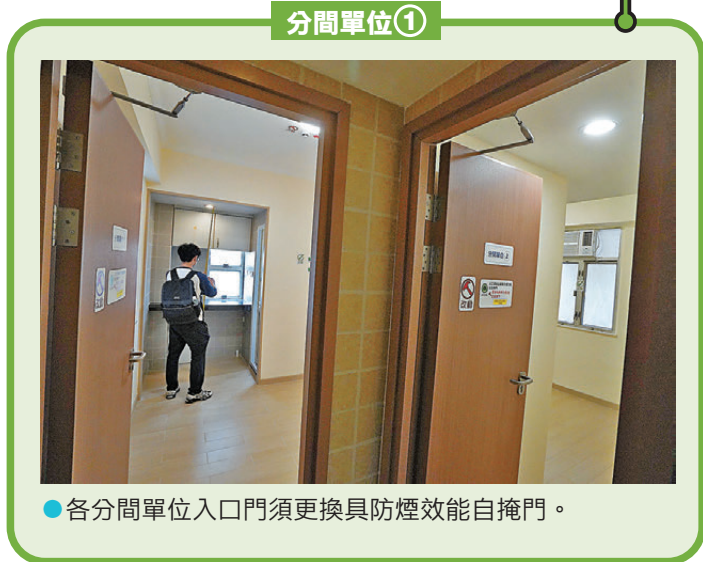
●各分間單位入口門須更換具防煙效能自掩門。