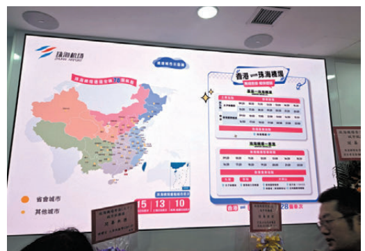
●太子往珠海機場「城市候機樓」24小時全天候營運，簡化跨境出行流程，實現港珠無縫接駁。

入太子商圈消費，產生雙向經濟效應。他期望太子候機樓能成為樣板，日後拓展至其他地區。 根據資料，太子候機樓提供的服務包括預辦登機手續、珠海機場豪華轎車直達專線介紹、實時航班動態資訊等。旅客可在市區完成行李託運及登機手續，免卻前往機場現場排隊輪候。現階段提供每日14個往返接駁班次，並採彈性機制，視乎需求「有客即加開」。因應首年開通，服務點至機場的單程車票，從原價330元改為特惠價260元發售。