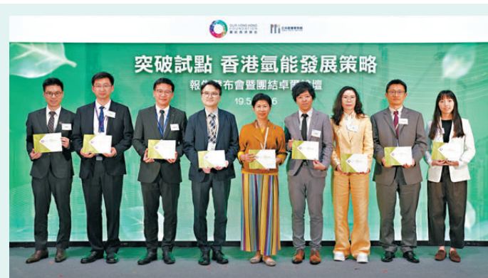
●團結香港基金昨日發表《突破試點 香港氫能發展策略》研究報告，就香港氫能發展提出政策建議。

他續說，行政和立法都有責任共同建設香港美好家園，雙方可透過相互理解、易地而處的態度面對問題以達至求同存異、「辯異生智」的雙贏結果。