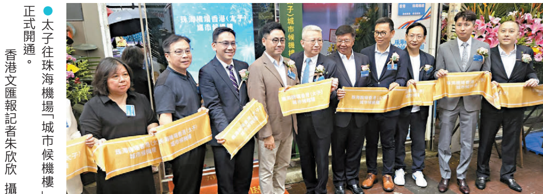
●太子往珠海機場「城市候機樓」正式開通。

香港文匯報訊（記者 朱欣欣）冠忠巴士集團旗下環島中港首個珠海機場「城市候機樓」昨日正式啟用，位於太子硯蘭街的候機樓提供人工預辦登機、豪華商務車跨境接駁等服務，每日提供14個往返珠海機場的跨境接駁車次，車程約兩小時，首年城市候機樓至珠海機場單程車票為260元。有立法會議員指出，香港機場的內地航點相對有限，上述往珠海機場的「點對點」服務正可補足香港航空業短板，為港人北上外遊提供更多元的航空選擇。