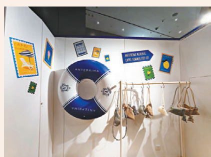
◀期間限定店洋溢夏日氣息。