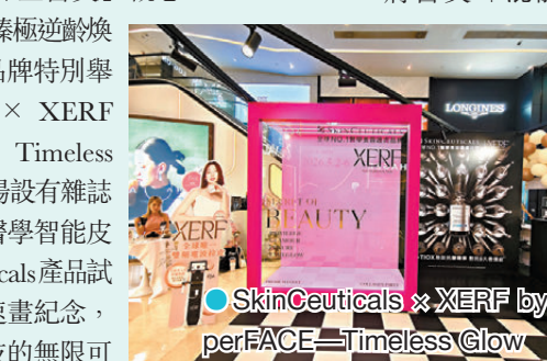
●SkinCeuticals x XERF by perFACE — Timeless Glow

年輕美學專家 perFACE 一直以嶄新醫美科技及國際認可的專業人才，為行業帶來新潮流。今次更與全球唯一雙頻電波拉皮科技 XERF 及抗氧化醫美護膚品牌 SkinCeuticals 聯手，推出革命性「全醫美」概念——HYBRID