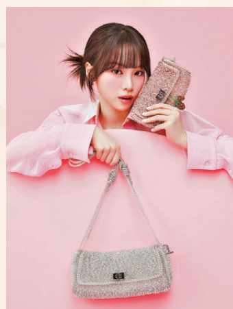
●全新 LUCCHETTO II WIREBAG