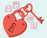
●SkinCeuticals x XERF by perFACE — Timeless Glow 發布會

年輕美學專家 perFACE 一直以嶄新醫美科技及國際認可的專業人才，為行業帶來新潮流。今次更與全球唯一雙頻電波拉皮科技 XERF 及抗氧化醫美護膚品牌 SkinCeuticals 聯手，推出革命性「全醫美」概念——HYBRID