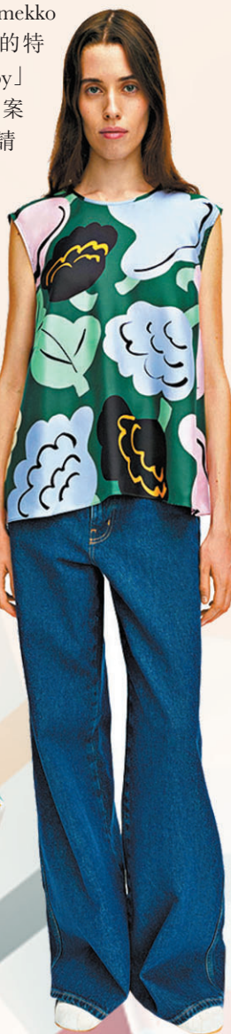
▲系列以創新的抽象花卉為設計。

本季的色感從牡丹粉、櫻花粉延伸至繡球藍、螺旋藻綠，並以開心果綠、蜜桃粉及清爽檸檬黃作點綴，營造出粉色、綠色與夏日黃色系之間的活力對話。印花設計展現創新思維，透過色彩變換，將花卉圖案轉化為充滿夏日氣息的檸檬園。經典元素與現代設計的結合成為系列亮點，例如將 60 年代標誌性的 Marimini 連身裙廓形重新演繹，拆解為趣味十足的夏日兩件套裝，並推出全新吊帶連身裙。輕盈飄逸的布料、大膽鮮明的印花、寬鬆流暢的經典輪廓，從迷你短裙到連身長裙，每一件作品都在講述關於色彩與自信的故事。