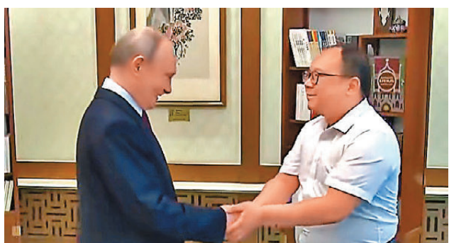
●普京與26年前合影的湖南少年彭湃(右)重逢。

5月19日晚，俄羅斯總統普京乘坐專機抵達北京，開啟對中國的國事訪問。在20日的行程中，普京總統的一項特殊安排格外引人關注，他在北京與2000年在北海公園合影的中國男孩彭湃再次見面。「心情平復了很多，跟普京總統見面之前，我都不敢相信這個事情是真實的。」談及這次重逢，彭湃表示，直