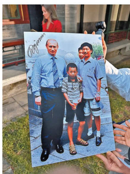
●普京在當年合影的放大照片上簽名留念。

5月19日晚，俄羅斯總統普京乘坐專機抵達北京，開啟對中國的國事訪問。在20日的行程中，普京總統的一項特殊安排格外引人關注，他在北京與2000年在北海公園合影的中國男孩彭湃再次見面。「心情平復了很多，跟普京總統見面之前，我都不敢相信這個事情是真實的。」談及這次重逢，彭湃表示，直