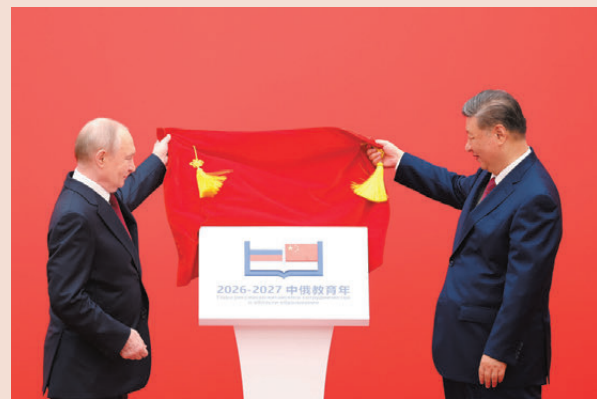
●5月20日下午，中國國家主席習近平同俄羅斯總統普京在北京人民大會堂共同出席「中俄教育年」開幕式。圖為兩國元首共同為「中俄教育年」徽標揭幕。

習近平強調，教育興則國家興，教育強則國家強。中俄要深化人才培養合作，共同培育國際頂尖人才隊伍和國家戰略科技力量，攜手攻克前沿科學難題，助力兩國創新發展；要踐行文明互鑒理念，推動文明傳承和教育治理經驗交流，共同提高工作水平；要屢續傳統友好情誼，進一步釋放教育合作潛力，促進兩國民眾相知相親，讓青少年在深入交流中增進友誼，培育中俄世代友好的接班人。相信在雙方共同努力下，「中俄教育年」必將取得圓滿成功。