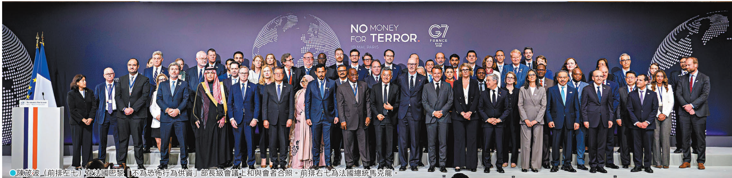
●陳茂波(前排左七)在法國巴黎「不為恐怖行為供資」部長級會議上和與會者合照。前排右七為法國總統馬克龍。

香港特區政府財政司司長陳茂波在巴黎時間5月19日繼續在巴黎的訪問行程，包括出席由法國主辦的「不為恐怖行為供資」部長級會議，與超過80個國家和地區的代表團成員，就加強全球合作打擊恐怖分子籌資等議題深入交流，並在討論環節上，就金融創新與恐怖分子融資問題發表意見。他在會上指出，中國香港一直堅定支持並貫徹落實反洗錢及打擊恐怖分子融資的國際要求，以完整的法律框架、風險為本的監管、充分的跨機構協作落實推進相關工作，並在財務行動特別組織最近一輪的相互評估中獲評為整體合規。