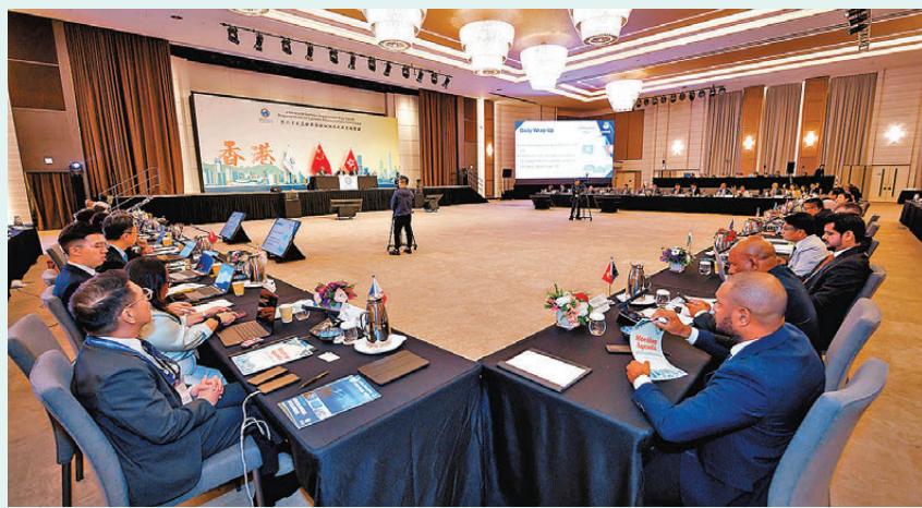
●香港海關舉行的第二十七屆世界海關組織亞太區首腦會議昨日結束。圖示亞太地區的海關機構和世界海關組織地區機構代表出席會議。

展望未來，香港海關將繼續推動合作，並落實本次會議所通過的策略重點，確保亞太區海關機構維持緊密聯繫、持續進步和保持韌性。