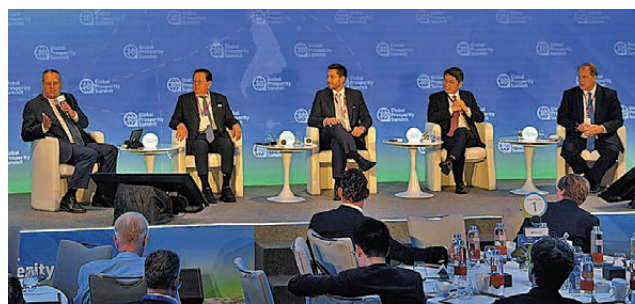
●多位專家在「全球繁榮峰會」上發言。

香港文匯報訊(記者 胡藝禾) 第三屆「全球繁榮峰會」20日在香港繼續舉行，美國總統特朗普第二任期以來的關稅政策，成為與會國際貿易專家的討論焦點。多名專家發言時稱，美國的「對等關稅」政策推高本國物價、打擊美國信譽，也會衝擊世界各國自由貿易。