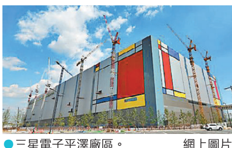
●三星電子平澤廠區。

香港文匯報訊 在三星電子工會近日醞釀大罷工之際，爆出工會疑製作「非工會成員黑名單」的爭議。為釐清真相，韓國警方擴大調查範圍，不僅掌握機與廠區的伺