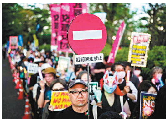
●在東京的國會議事堂前，日本民眾手持標語參加抗議集會。

香港文匯報訊 韓聯社19日報導，韓國總統李在明當天在慶尚北道安東市與到訪的日本首相高市早苗舉行會談，雙方圍繞供應鏈穩定、能源安全及地區局勢等議題展開磋商。然而因歷史遺留問題及日本「再武裝」爭議，這次會