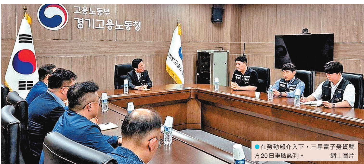
●在勞動部介入下，三星電子勞資雙方20日重啟談判。

香港文匯報訊 韓國三星電子勞資雙方5月20日再度協商，但仍未能達成共識，工會宣布按照原計劃於21日展開全面罷工。為阻止罷工危機，韓國勞動部長20日下午親自介入斡旋，雙方展開新一輪調解程序，當局稱希望雙方能在最後關頭展開對話，最終達成協議。三星電子工會晚上指出，勞資雙方達成初步薪酬協議，工會決定暫緩罷工行動，相關協議將交由工會成員表決。