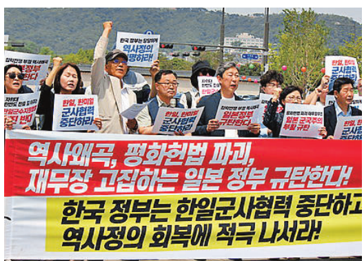
●韓民眾在首爾光化門舉行集會，反對韓日軍事合作。