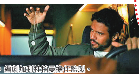
●電影由《小丑回魂》編劇加利杜柏曼擔任監製。

每年都有大約1.3億人開長途車去旅行，當中大約15,400人從此人間蒸發。一對情侶原本對美國公路旅行有着理想化、浪漫的憧憬，在高速公路上目睹一宗奪命車禍，司機不幸身亡，離開車發現場後不久，他們開始發現自己已被惡靈「乘客」糾