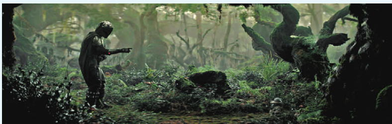
●電影《星球大戰：曼達洛人與古古》在香港上映。