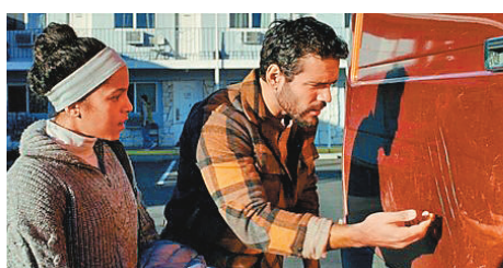
●《乘嚇》今日在港上映。