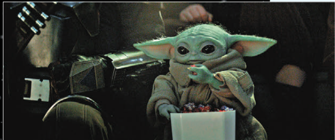
●《星球大戰》系列久違7年回歸大銀幕。