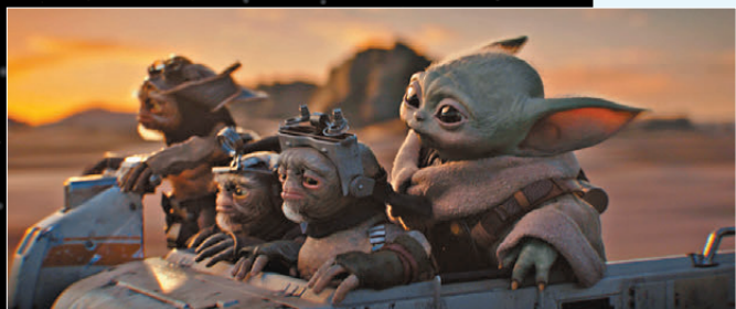
●古古將成為影迷新寵兒。