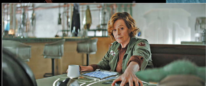
●薛歌妮韋花重磅加盟演出。

《星球大戰》重金打造全新巨製《曼達洛人與古古》由兩大人氣主角曼達洛人與古古勇闖遙遠銀河，展開全新驚險刺激的歷險之旅，正邪大戰一觸即發！不過，7年來第一部《星戰》院線片，都值得慶賀。對劇集擁躉而言，在IMAX銀幕上再次見到鐵頭盔與大眼仔，聽到那句「This is the way」，加上古古舉手投足皆有尤達的影子，已經值回票價。莊法來奧的視覺調度和艾美獎級製作，依然是荷里活頂尖水平。