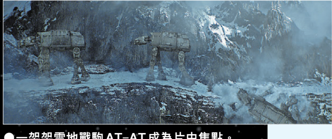
●一架架雪地戰鬥AT-AT成為片中焦點。