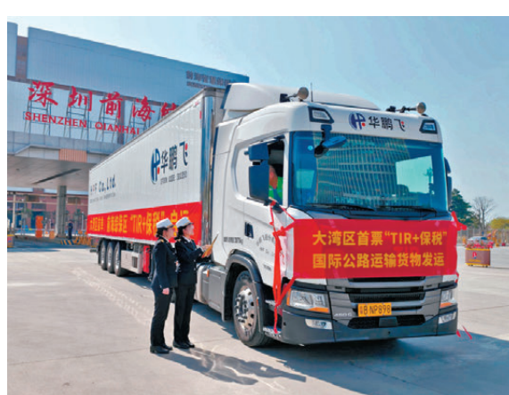
●大灣區11市將以一個整體對外發布貨物貿易統計數據。圖為近期大灣區首單「TIR 保稅」國際公路運輸車輛順利發運。

優勢，對高時效要求貨物實施「快檢快放」「優先通關」，持續增強「兩步申報」「綠色關鎖」等舉措效益，大橋口岸報關單提前申報率超99.9%。同時，支持大橋經貿新通道建設，推進粵港澳物流園保税倉庫、出口監管倉庫與大橋口岸聯動，助推首飾、電子元件、「新三樣」等高附加值產品成為通關主力商品。我們還將支持打通對接香港、澳門國際機場的跨境電商產品「出海」新通道，推動電商包裹源源不斷地發往港澳、通達全球。