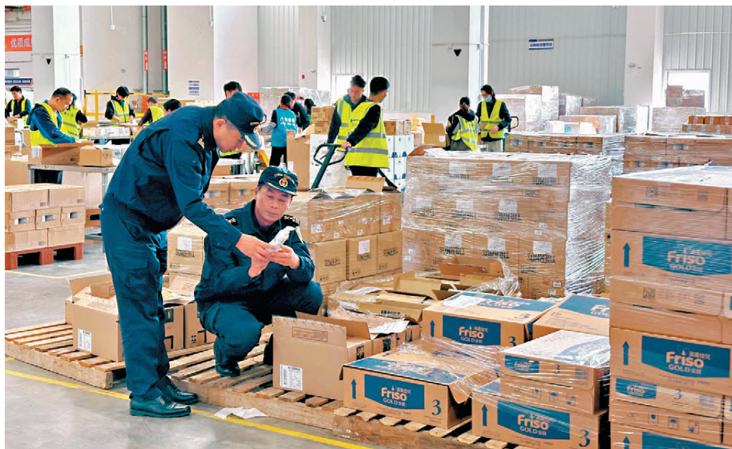
●《若干措施》將加速大灣區貨物跨境流通。圖為佛山海關關員在佛山國際陸港保税物流中心對進口貨物進行核實。

又如，在前海合作區優化香港科研機構暫時進境科研設備的擔保方式，並在此基礎上持續優化進出區科研人員、貨物監管模式，更好支持跨境科研交流。