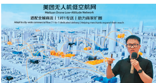
●美團毛一年介紹香港業務布局進展。

值得關注的是，隨著航網進入常態化營運，美團無人機的商業化合作也迎來全新進展，正式面向全國低空物流營運商招募授權服務商。今年初