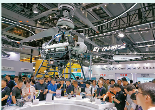
●大疆無人機FC200吸引大量觀眾。

香港文匯報訊(記者 李昌鴻 深圳報道)在昨日開幕的深圳無人機展上，內地無人機龍頭大疆的展位吸引了大量的觀眾，其新推出大載重無人機FC200，業界認為此類產品的應用將推動低空重載運輸從試點加快邁入規模化商業化新階段。