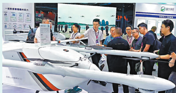
●豐翼科技正與香港民航處合作研究和規劃，以豐舟90執行跨境無人機航線。