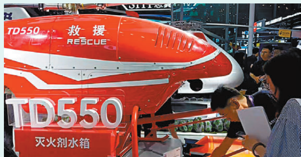
●聯合飛機研發的滅火無人機TD550可助力香港眾多樓宇的消防和市民安全。