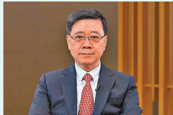
▲行政長官李家超以視像方式致辭時表示，香港憑藉自身多重優勢，能夠為世界搭建對話橋樑，拓展多邊合作空間，與全球共享穩定與增長的豐碩成果。