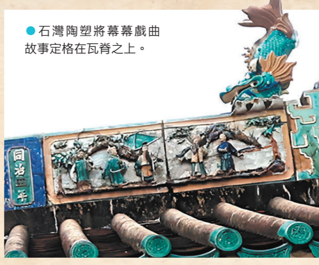
●石灣陶塑將簷幕戲曲故事定格在瓦脊之上。

長洲雖然面積僅2.46平方公里，卻昂然佇立着八大主要廟宇，更有二三十座細小的土地廟與福德祠散落在巷弄之間，貫穿島民的千年信仰。其中，坐落於北社的天后古廟，是長洲最早的廟宇，一磚一瓦、一雕一琢，無聲地記錄着漁家文化的起落沉浮。 該廟是典型的嶺南建築，採用「兩進三開式」古樸布局，講求對稱、和諧的美學。簷上那列走過百年的石灣陶塑——它製於清同治四年（1865年），將簷幕戲曲故事定格在瓦脊之上，在寶珠與紫雲神獸的襯托下，歷經風雨仍栩栩如生。殿內最沉靜的守望者，是一尊乾隆時期的四足銅鼎，上面銘刻的「長洲墟」三個字，是解開長洲早期商業繁華歲月的關鍵鎖鑰。 圍繞該廟的還有神秘的民間傳奇。島民口耳相傳，古廟正坐落於風水學中的「白虎位」；過去，廟前總是高懸着兩盞紅燈籠，當夜色籠罩，燈火點亮，恍如一雙「虎眼」凝視着中興街，故老一輩島民，對它多了一份誠惶誠恐的敬畏之情。