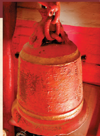
●廟內銅鐘鑄於1767年，是廟內最古舊文物。

長洲雖然面積僅2.46平方公里，卻昂然佇立着八大主要廟宇，更有二三十座細小的土地廟與福德祠散落在巷弄之間，貫穿島民的千年信仰。其中，坐落於北社的天后古廟，是長洲最早的廟宇，一磚一瓦、一雕一琢，無聲地記錄着漁家文化的起落沉浮。 該廟是典型的嶺南建築，採用「兩進三開式」古樸布局，講求對稱、和諧的美學。簷上那列走過百年的石灣陶塑——它製於清同治四年（1865年），將簷幕戲曲故事定格在瓦脊之上，在寶珠與紫雲神獸的襯托下，歷經風雨仍栩栩如生。殿內最沉靜的守望者，是一尊乾隆時期的四足銅鼎，上面銘刻的「長洲墟」三個字，是解開長洲早期商業繁華歲月的關鍵鎖鑰。 圍繞該廟的還有神秘的民間傳奇。島民口耳相傳，古廟正坐落於風水學中的「白虎位」；過去，廟前總是高懸着兩盞紅燈籠，當夜色籠罩，燈火點亮，恍如一雙「虎眼」凝視着中興街，故老一輩島民，對它多了一份誠惶誠恐的敬畏之情。