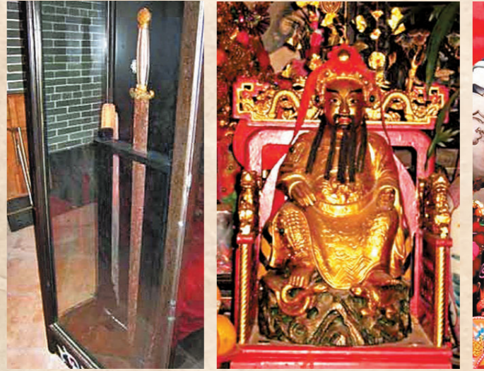
●玉虛宮內古劍曾失而復得。 ●在長洲作寓公的太平山三十間長洲廟宇實錄 玄天上帝有鬚鬚。長洲廟宇實錄 現時的北帝神像。

作為香港一級歷史建築的長洲玉虛宮（即北帝廟），興建於清乾隆四十八年（1783年），不僅是島民傳統信仰中心，背後更流傳着關於驅瘟、神蹟與社區歷史的傳奇故事。 世人眼中的北帝，多數是披髮仗劍、長鬚飄逸，盡顯威嚴。但該廟主殿內供奉的北帝神像卻面容清淨，毫無鬚髮，在全港乃至嶺南一帶都極為罕見。 這抹獨特的容顏背後，藏着一段段火傳奇——相傳長洲某年遭逢祝融之災，危急之際，北帝憤而顯聖降臨驅散萬民，其間鬍子不慎被大火燒光，自此地雖然成為「無鬚北帝」，但是與島民同甘共苦的永恆見證。 另一件鎮廟之寶是宋朝大鐵劍。這把鐵劍並非由鐵匠鑄製送來，而是早年島民出海打撈時意外從海底撈來。漁民相信此劍能助北帝降妖伏魔，於是將劍供奉廟內。但幾十年前寶劍意外失竊，島民大為緊張，最後在神明指引下，歷經二十多天尋覓終於失而復得，續寫該廟的神護神話。