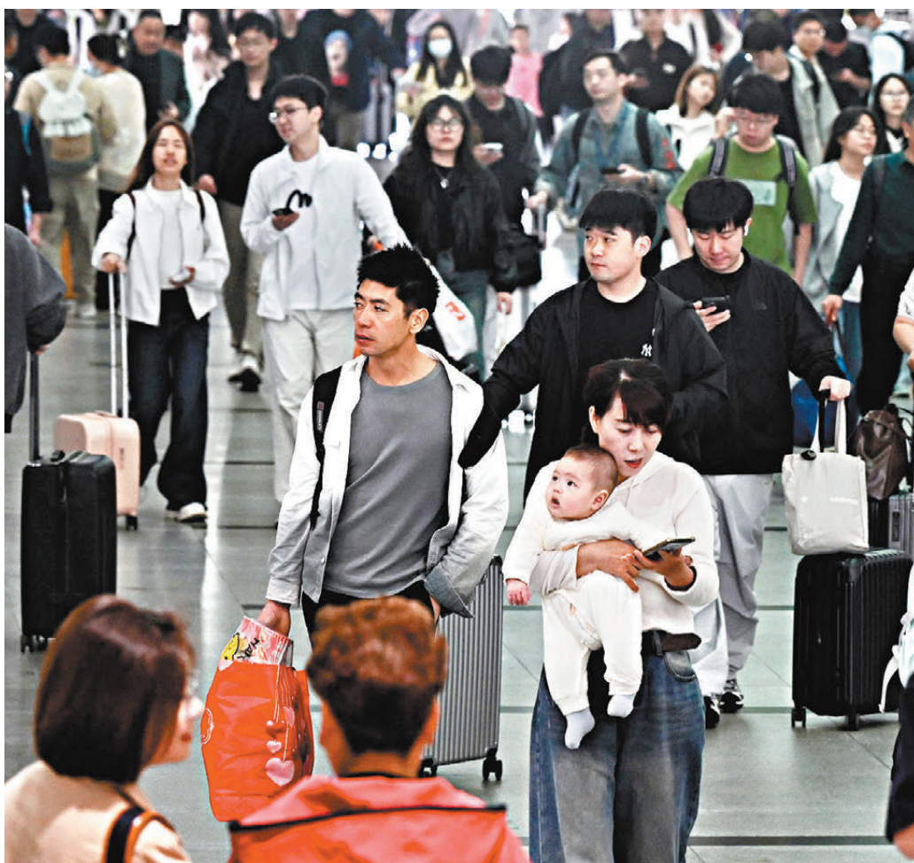
●國家統計局22日發布2025年全國1%人口抽樣調查主要數據公報，男性人口為71,722萬人，佔51.03%；女性人口為68,823萬人，佔48.97%。圖為5月1日，前往福州火車站候車廳候車的民眾。

周密指出，國民整體受教育水平持續提升，是人口發展的重要正向趨勢。「全社會對教育學習的重視程度不斷提高，人力資本將持續積累優化，而高素質的人口結構，也為中國經濟社會轉型升級築牢了人才根基，也能夠更好適應未來技術迭代、產業升級與科技應用拓展的發展需求，有效緩衝外部環境波動帶來的負面衝擊，為經濟高質量發展提供持續支撐。」