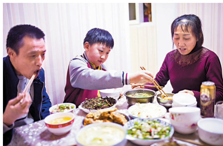
●中國家庭戶規模持續縮小，這一現象直觀反映出當代居民的生活與居住模式正在發生深刻轉變。資料圖片