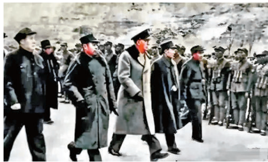
●馬歇爾訪華調解國共關係。

陳納德不僅和史迪威背後的美國陸軍派有深刻的戰略分歧，而且同美國陸軍航空隊司令阿諾德也在戰略理念以及個人風格上有諸多衝突。阿諾德被稱為「美國現代航空之父」。他1938年出任美國陸軍航空兵司令，將航空兵從一支小型力量迅速建設成擁有250萬人、近7萬架飛機的全球頂級空中力量。阿諾德是戰略轟炸派，他堅信重型轟炸機能摧毀敵人的工業經濟核心和民心，迫使敵人投降。二戰期間，阿諾德是盟軍空中力量的核心決策者，盟軍空中力量的「大腦」，手握所有陸航部隊的指揮權。