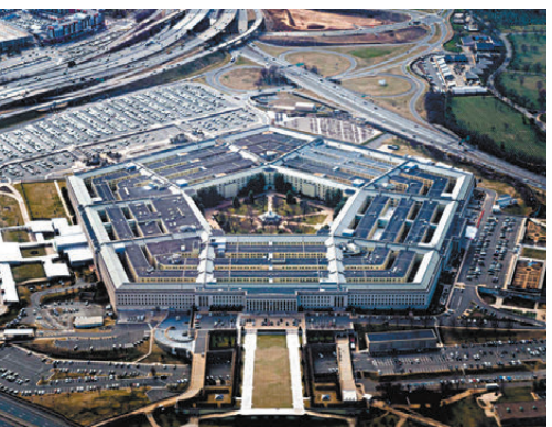
●華盛頓五角大樓周邊多家薄餅店生意在22日晚間異常繁忙。資料圖片

香港文匯報訊 綜合美國媒體及社媒監測數據，在美國總統特朗普召集國家安全團隊討論對伊朗發動新一輪打擊之際，華盛頓五角大樓周邊多家薄餅店生意在22日晚間異常繁忙，俗稱「Pizza指數」的民間觀察指標顯著上升，外界普遍將此解讀為美國軍方或進入高強度作戰前部署的間接信號。