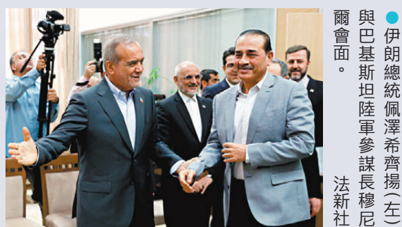
●伊朗總統佩澤希齊揚與巴基斯但陸軍參謀長穆尼爾會面。

美國總統特朗普22日則表示，伊朗戰事將會很快完結，國務卿魯比奧亦形容與伊朗的談判取得些微進展，並重申伊朗不能擁有核武。