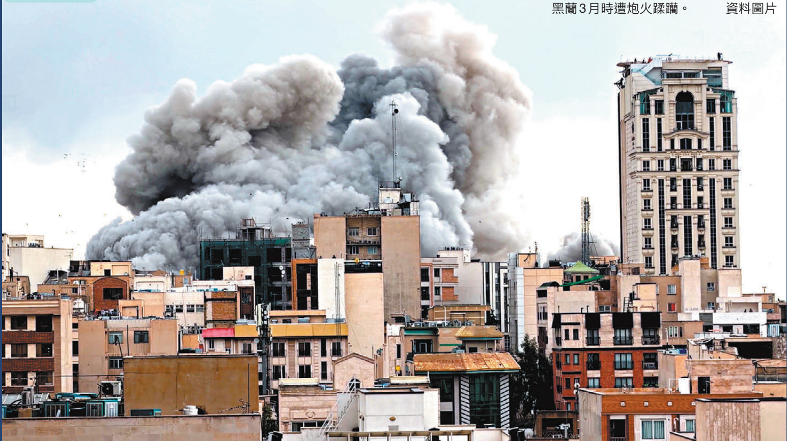
●美國計劃再對伊朗發動攻擊。圖為德黑蘭3月時遭炮火蹂躪。

香港文匯報訊 美國總統特朗普5月22日召集國家安全團隊開會，商討恢復對伊朗採取軍事行動的可能性。報道指特朗普正認真考慮發動一次具「決定性」意義的大規模打擊，並在會後更改周末行程，決定留守白宮，甚至不出席長子婚禮。與此同時，有消息稱伊朗伊斯蘭革命衛隊已進入最高戒備狀態，並可能於周末再次關閉西部領空。