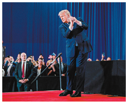
●特朗普對與伊朗進行的談判感到日益沮喪。

美國參議院軍事委員會主席、共和黨議員威克22日在社媒發文，敦促特朗普恢復對伊朗的戰爭。他聲稱特朗普身邊有人出「主意」，去尋求一份沒有價值的協議，認為美軍應繼續摧毀伊朗軍事力量，重新打開霍爾木茲海峽。