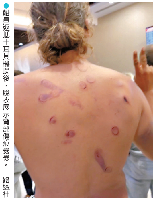
船員返抵土耳其機場後，脫衣展示背部傷痕累累。

香港文匯報訊「全球堅韌船隊」約50艘船隻組成的人道救援船隊，於5月20日試圖突破以色列對加沙的海上封鎖、運送援助物資時，在國際海域被以軍攔截，約430名活動人士被捕。多名獲釋人員22日指控以色列軍方，稱其在被拘留期間遭受嚴重虐待及性暴力。歐洲多國已介入調查。