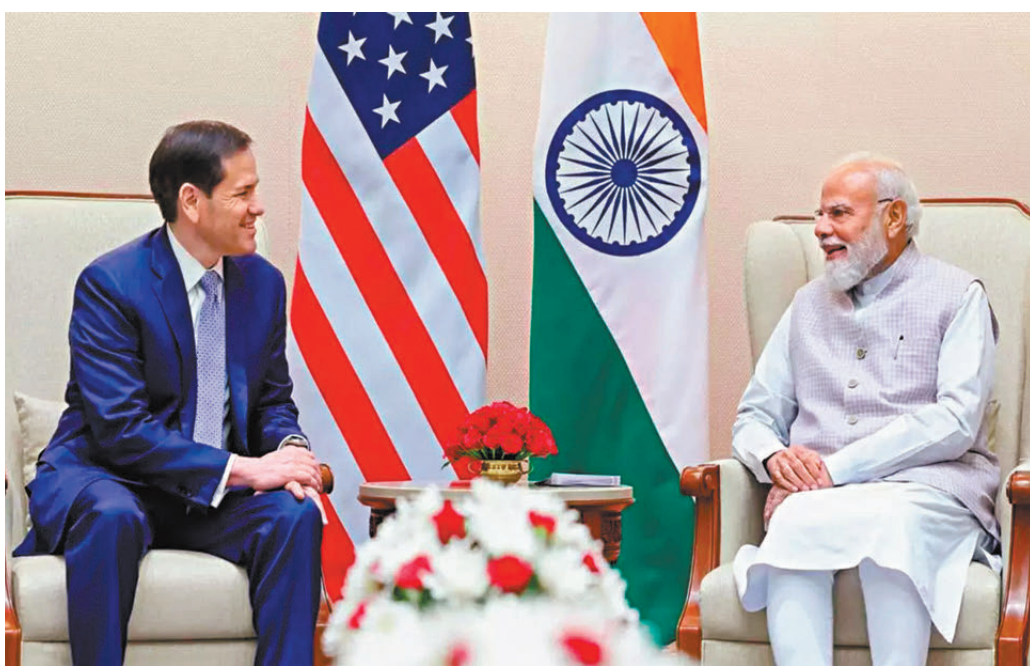
●魯比奧(左)與莫迪會面，試圖重振美印兩國夥伴關係。

魯比奧也宣布，委內瑞拉臨時總統羅德里格斯將於本周訪問印度，討論石油銷售事宜。魯比奧說，美國與印度有很多方面需要合作，「他們是我們重要的合作夥伴，」他表示這次訪問印度意義重大，因這將給他一個與「四方安全對話」成員國部長會面的機會，「我們承諾在那裏與四方安全對話機制(Quad)會面，這很重要，我很高興我們現在能在印度舉行會議。」