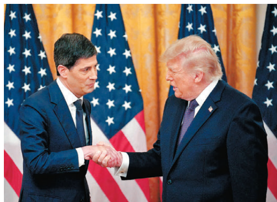
●沃什(左)在就任儀式上與特朗普握手。

目前聯儲局資產規模約佔美國經濟總量23%，是2008年金融海嘯前的約7倍，任何架構改革將影響政策制定者應對未來危機的方式。架構改革可能會產生一種不尋常的局面，令沃什一方面能滿足特朗普降低利率要求，另一方面仍可維持較為緊縮的融資環境。根據聯儲局一個內部方案，聯儲局最多可從9萬億美元(約71萬億港元)資產中縮減2.1萬億美元(約16.4萬億港元)，但這進程需緩慢推行，無論是特朗普政府抑或金融市場都不能指望一夜之間發生翻天覆地的變化。