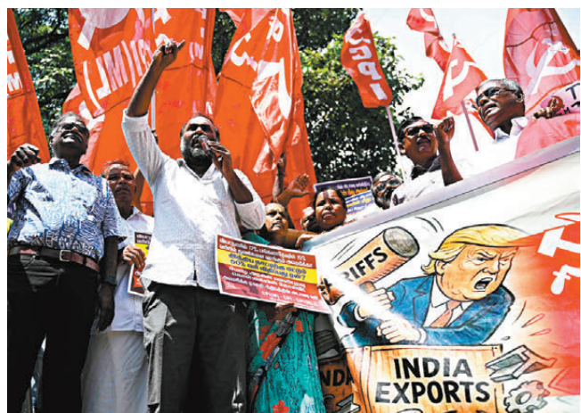
●特朗普去年對印度輸美產品額外徵收25%關稅，引發印度民眾抗議，加深兩國之間裂痕。

據《印度教徒報》報道，魯比奧訪問期間，兩國官員將試圖推動雙邊貿易協定的最終敲定，但美國最高法院就特朗普引用《國際緊急經濟權力法》徵收關稅屬違法的判決所帶來的不確定性，令協議至今未能完成。