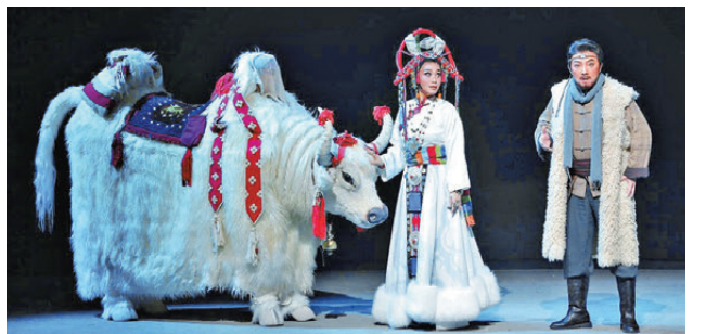
●秦腔《紅河谷》在西安演出，吸引眾多戲迷捧場。