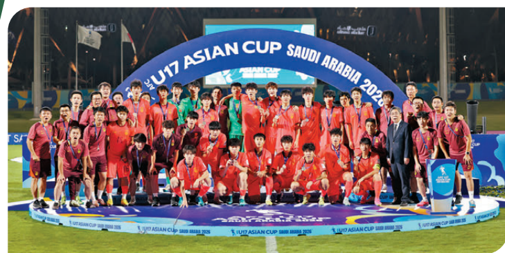
●國足U17在頒獎禮上領取獎牌。

賽後，國家體育總局與中國足协隨即致賀信，讚揚球隊頑強拼搏、永不言棄的精神，並鼓勵隊伍再接再厲。憑藉本屆賽事表現，這支U17國足已成功鎖定今年11月在卡塔爾舉行的U17世界盃(世少盃)入場券。這也是中國男足各級別國字號球隊时隔21年重返國際大賽決賽圈，屆時國足將與西班牙、摩洛哥及斐濟同處H組。