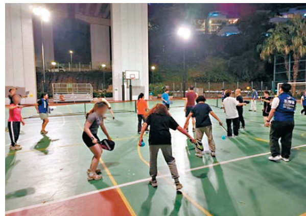
●荃灣郊區關愛隊舉辦「匹克球體驗日」，吸引不少當區居民參與。

荃灣郊區關愛隊於4月22日圓滿舉辦「匹克球體驗日」。關愛隊將這項近年席捲全球的新興運動匹克球(Pickleball)帶進社區，成功打破年齡與背景的界限，吸引區內青少年及居民參與，為社區注入動感與活力。匹克球結合網球、羽毛球和乒乓球的元素，因其上手快、社交性強的特點，深受不同年齡層歡迎。活動當日有不少區內居民參與，在專業教練