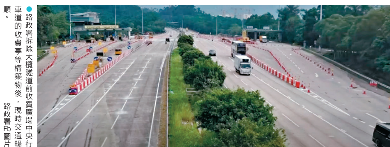
●路政署拆除大欖隧道前收費廣場中央行車道的收費亭等構築物後，現時交通暢順。