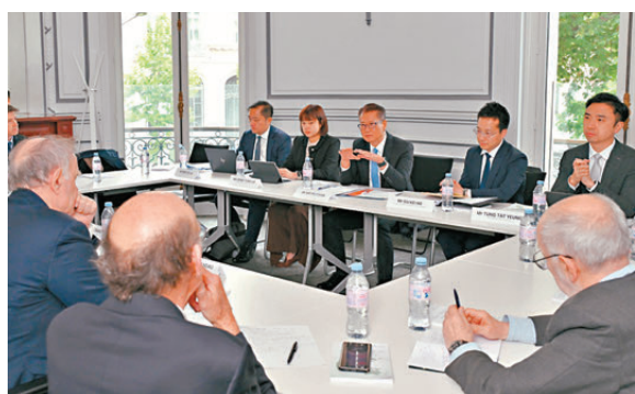
●陳茂波一行在法國巴黎與智庫機構巴黎亞洲中心理事會會面。

歐洲的一些代表既希望內地企業到當地投資，以帶來資金、技術和在當地創造就業職位，卻同時對歐洲本土企業將面對更大競爭存在疑慮。在今次訪問中，已邀請他們組團到香港和大灣區考察，了解這裏的機遇和探索具彈性的合作模式，為雙方帶來更穩定長遠、互惠共贏的發展機會。