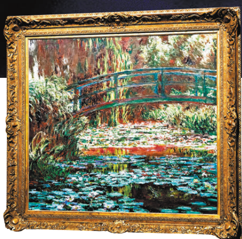
●克勞德·莫奈《睡蓮池》