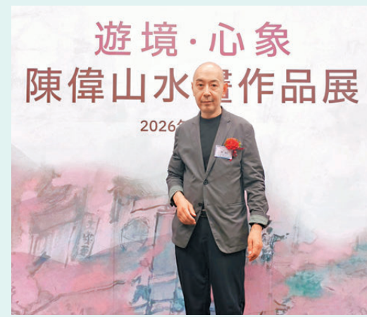
●實地寫生讓陳偉在創作中獲得很多樂趣。