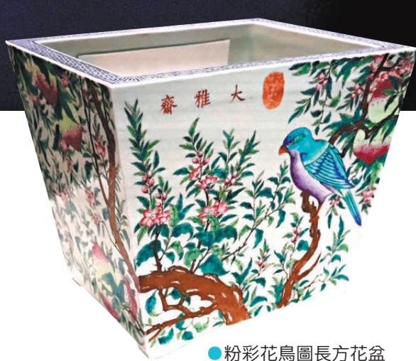
●粉彩花鳥圖長方花盆