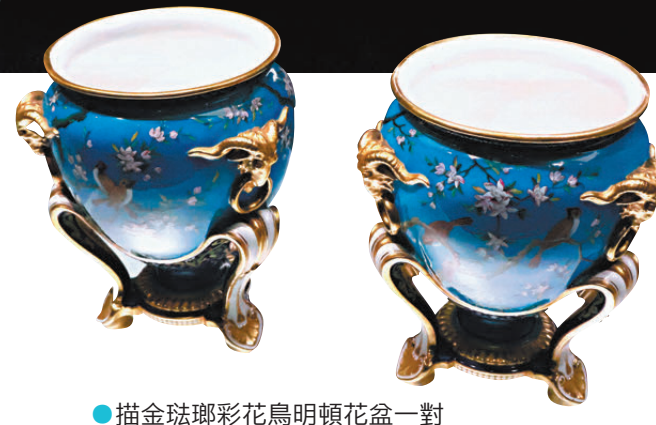
●描金珐瑯彩花鳥明頓花盆一對

據香港藝術館總館長莫家詠介紹，香港藝術館是園林系列巡展的最後一站，展覽早前曾於故宮博物院、蘇州博物館及寧波博物院舉行。此次展覽逾六成展品只於香港站呈現。