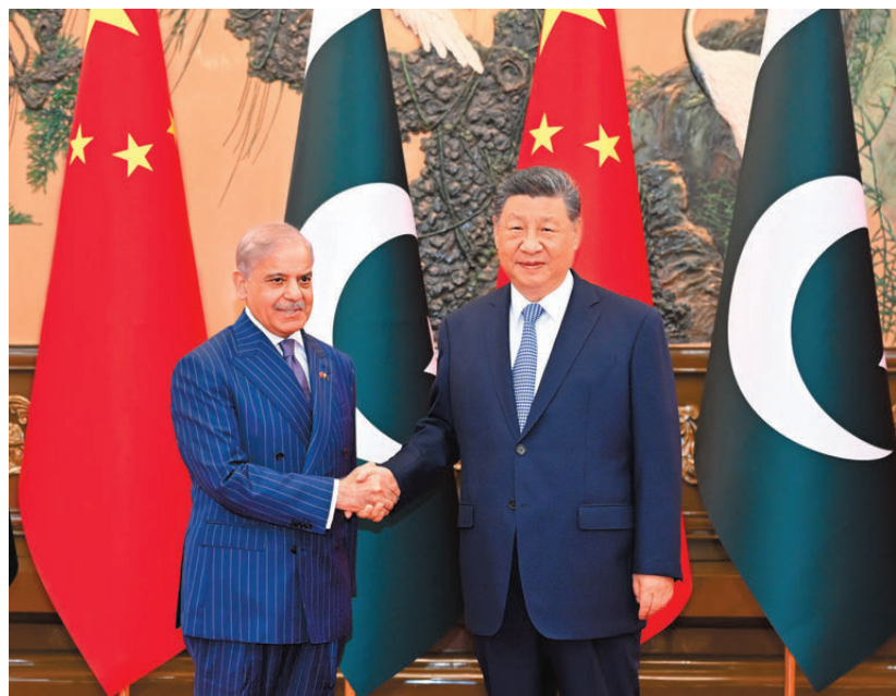
●5月25日下午，國家主席習近平在北京人民大會堂會見來華進行正式訪問的巴基斯坦總理夏巴茲。