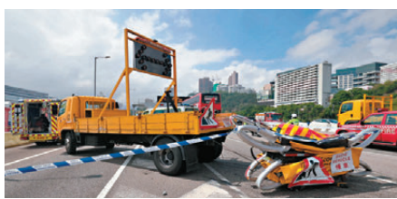
●撞工程車及防撞欄