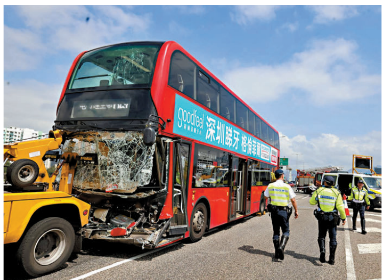
●巴士車頭嚴重毀爛。

香港文匯報訊(記者 蕭景源)青葵公路發生九巴狂撼工程車，釀成車長和乘客共22人受傷的意外。昨午近2時，一輛載乘客、由灣仔會展站往屯門建生總站的960號線雙層九巴，沿青葵公路往機場方向駛至近荔枝角公園對開時，疑收掣不及，直撞向前方一輛正在路中處理另一宗交通意外的箭嘴工程車尾。工程車被推前多個車位後，餘勢未了再撞向前方另一輛工程車車尾始停下。其間一名工作人員狂奔兩條行車線閃避保命，涉事九巴車長受傷一度被困，事後被警方以涉嫌危險駕駛拘捕。