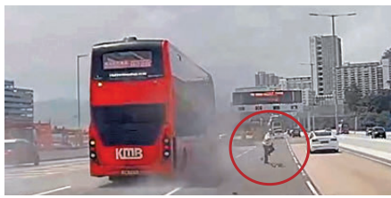
●工程人員(紅圈示)跨越行車線奔跑逃命。