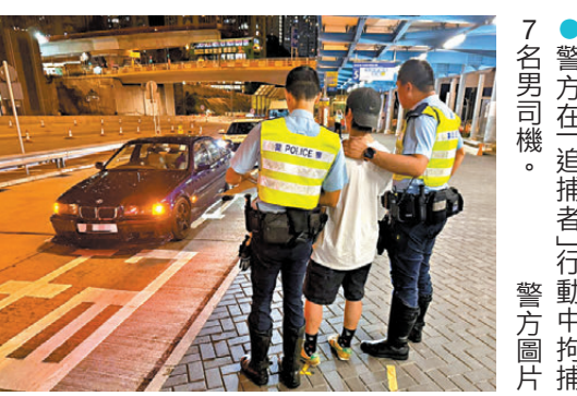
●警方在「追捕者」行動中拘捕7名男司機。

險駕駛及酒後駕駛。警方提醒駕駛者，上述嚴重罪行一經定罪，可能面臨監禁及停牌處分。警方會繼續採取執法行動，以維護道路安全，保障市民生命財產，呼籲駕駛者切勿以身試法。