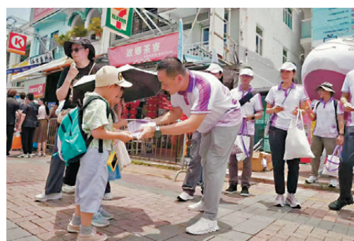
●警務處國家安全處處長江學禮向小朋友派發國安紀念品。