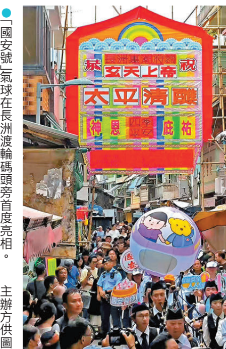
●「國安號」氣球首現飄色巡遊。