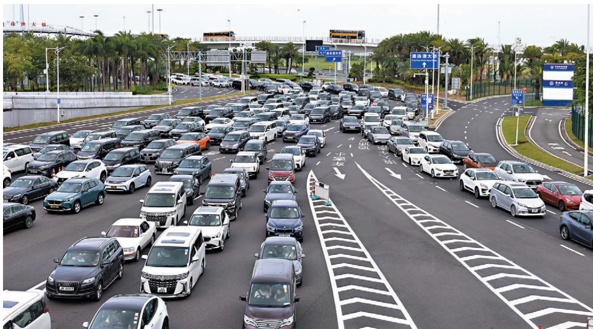
●自駕北上成為愈來愈多港澳居民跨境出行的首選方式之一。

邊檢部門表示，繼去年經大橋珠海口岸出入境的港澳旅客近1,800萬人次後，今年有望首次突破2,000萬人次大關。