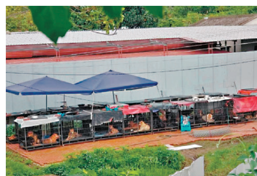
●狗場內有狗隻被畜養於籠內置於露天空地受雨淋，未獲足夠遮蓋。

香港文匯報訊(記者 蕭景源)錦上路元崗新村清潭路一個狗場，早前被投訴疑將狗隻囚於籠中放在空地任受風吹雨打。漁農自然護理署上週五(22日)已在警方協助下進入狗場檢走12隻狗送往動物管理中心看管，若有足夠證據會對相關人等提出檢控。愛護動物協會昨日表示，該狗場與另一個位於元朗水蕉新村的「520浪浪加油站」狗場屬同一負責人，早前已接獲多宗有關該兩個狗場的投訴，希望漁護署可再安排與愛協進行聯合巡查，讓愛協就動物福利提供專業意見，釋除公眾疑慮。