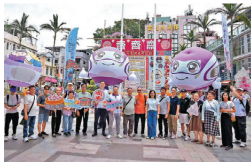
●警務處國家安全處處長江學禮日前穿梭長洲太平清醮飄色巡遊活動。

香港文匯報訊 一年一度的國家級非物質文化遺產盛事——太平清醮飄色會景巡遊前日(24日)圓滿舉行，今年迎來全新亮點——警務處國家安全處(國安處)的「國安號」宣傳氣球首度在長洲升空，把國家安全教育融入傳統民俗節慶，讓市民在感受節日氣氛的同時，加深對「總體國家安全觀」的認識。