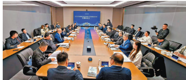
▲香港企業家走進貴州洽談投資。