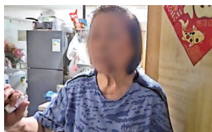
◀匪徒尾隨事主乘升降機伺機犯案。

香港文匯報訊(記者 蕭景源)前日下午，一名戴鴨舌帽匪徒假扮居民進入土瓜灣益豐大廈後，尾隨一名七旬老婦乘升降機至家門外搶劫，糾纏間老婦被拉跌受傷，匪徒趁機搶去內有手機、現金及八達通卡等財物的手袋逃去無蹤，事後鄰居代為報警。警方已將案件列作搶劫，交由九龍城警區重案組第二隊跟進。老婦昨日受訪時直言仍然「好驚」，嚇得一夜失眠，並指益豐大廈屬舊樓及治安不好，今次事件後會考慮賣樓換屋。