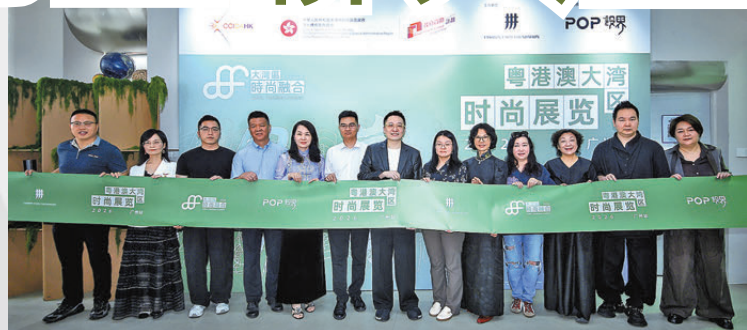
●一眾來自粵港澳大灣區不同城市的時裝業界人士為展覽揭幕。