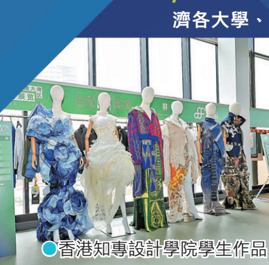
●香港知專設計學院學生作品

來自大灣區六所專業設計院校，包括香港知專設計學院、香港高等教育科技學院、香港理工大學時裝及紡織學院、聖方濟各大學、惠州學院旭日廣東服裝學院及澳門生產力暨科技轉移中心的學生，以天馬行空的創意、豐富的人文內涵與獨特的設計視角，成為展覽的一大亮點。