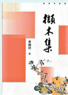
《擷木集》作者：曹順祥 出版社：太平書局

對於其他有志者，我給予同樣的建言，致以同樣的祝福。關於「好評」，要補充說明一下。有