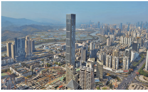
從地王大廈鳥瞰深圳河兩岸。

地王大廈建成時為亞洲最高建築，並長達16年雄踞「深圳第一高樓」寶座。此外，地王大廈還擁有兩項「第一」：一是土地招標創下了