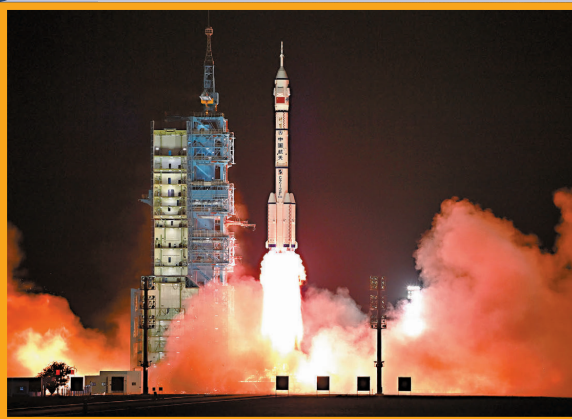
●5月24日23時8分，搭載神舟二十三號載人飛船的長征二號F遙二十三運載火箭在酒泉衛星發射中心點火發射升空。