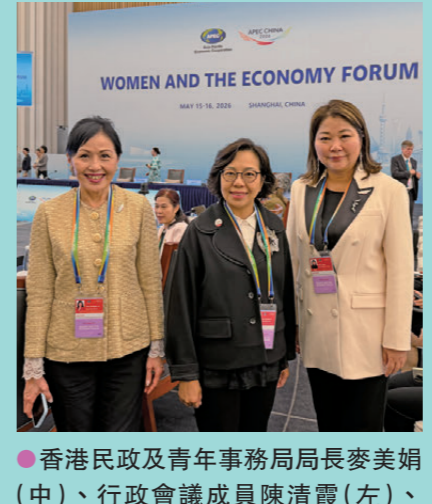
● 香港民政及青年事務局長麥美娟(中)、行政會議成員陳清霞(左)、滬港婦女會創會會長榮吳佩儀(右)合照。