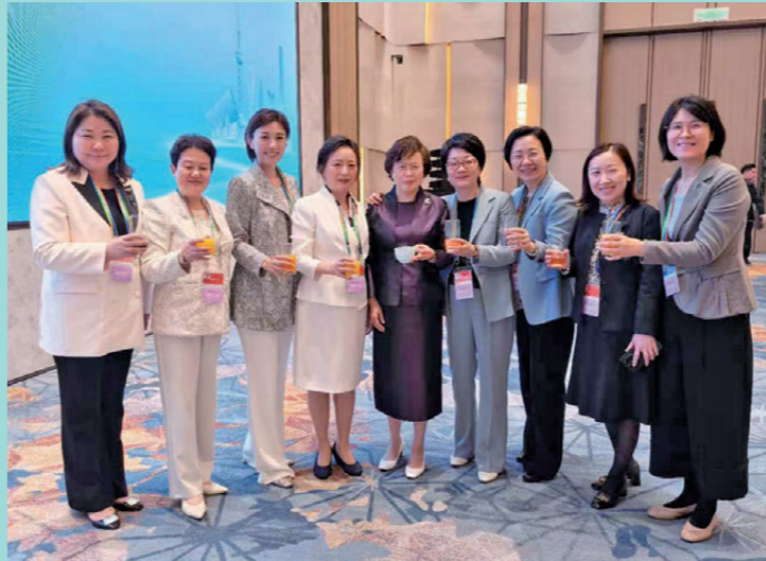
● 全國婦聯副主席黃曉薇(中)、上海市婦聯主席張華(右四)、滬港婦女會創會會長榮吳佩儀(左一)與其他女性代表合照。

出席亞太經合組織(APEC)婦女與經濟論壇的嘉賓還有上海市婦女聯合會主席張華、香港民政及青年事務局長麥美娟、行政會議成員陳清霞、滬港婦女會創會會長榮吳佩儀等。