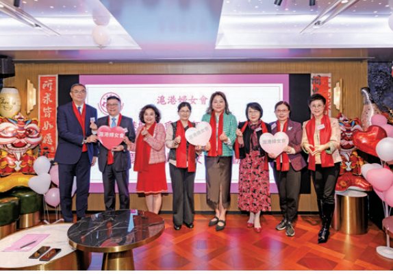
● 2026年3月3日，滬港婦女會舉辦馬年元宵聯誼暨慶祝三八婦女節活動。