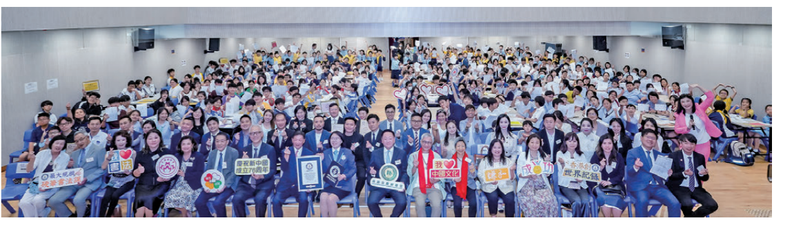
● 2025年10月17日，滬港婦女會舉辦「健力士金筆大師講堂——齊創硬筆書法世界紀錄」活動。