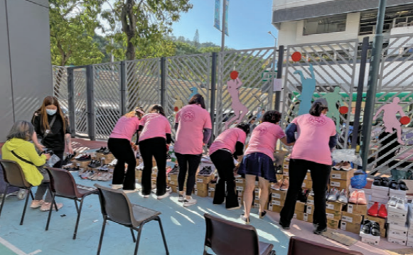
● 香港特區政府給予上海市兒童基金會捐贈的感謝狀。