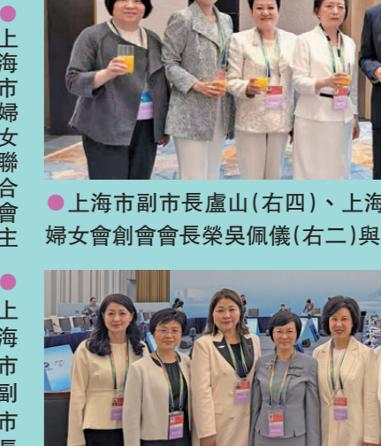
● 上海市副市長盧山(右四)、上海市婦聯副主席金佩(右一)、滬港婦女會創會會長榮吳佩儀(右二)與上海市女企業家代表團合照。