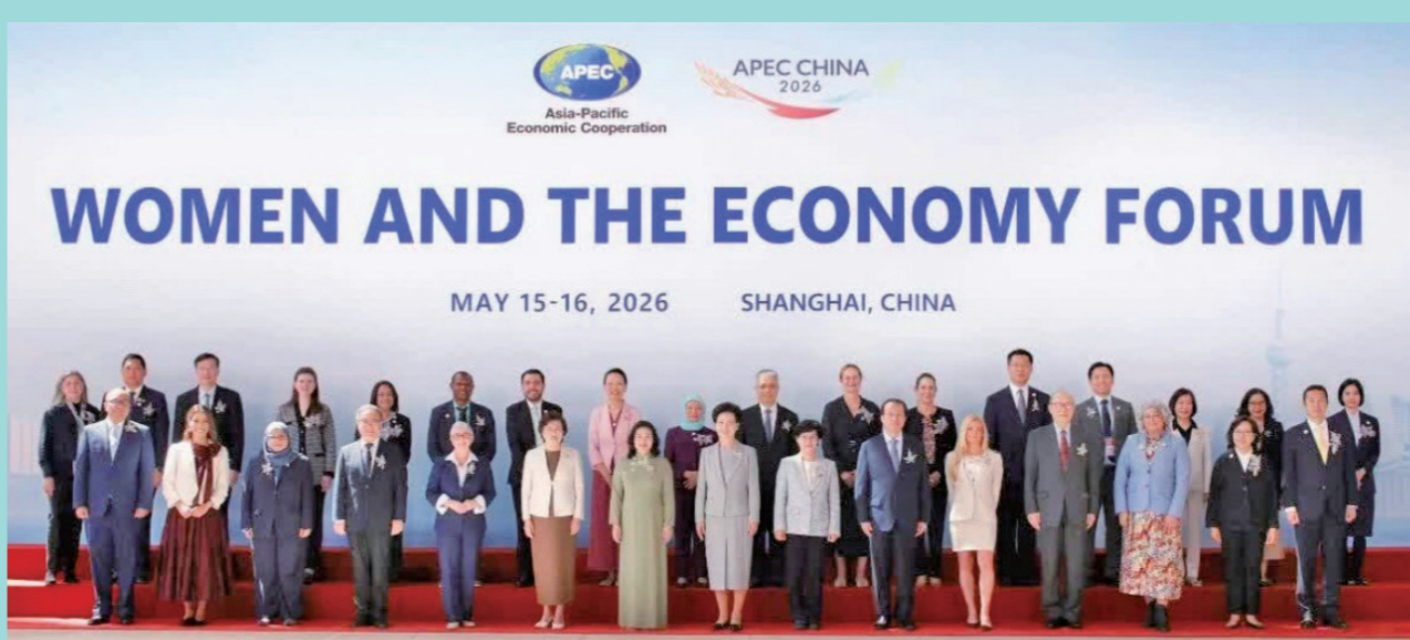
● 亞太經合組織(APEC)婦女與經濟論壇在上海舉行。

5月15至16日，亞太經合組織(APEC)婦女與經濟論壇在上海舉行。國務委員、全國婦聯主席馮瑜萍出席開幕式並致辭。