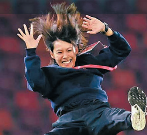
●「牛丸」憑勇氣跨過舒適圈，在內地球壇闖出一片天。陳婉婷的圖片