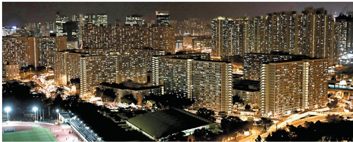
●中電昨日公布，6月的燃料調整費為每度電42.6港仙，較5月上升2.2仙，加幅約5.4%。圖為九龍彩虹及啟德一帶萬家燈火。

受國際油價波動影響，香港兩間電力公司的燃料調整費持續上升。繼港燈日前宣布上調燃料調整費，中電昨亦於網頁公布，6月的燃料調整費為每度電42.6港仙，較5月的40.4仙上升2.2仙，加幅約5.4%，是自4月開始連續3次上調以來，升幅最大的一次。若連同基本電費，6月淨電費為每度電143.8仙，較5月升約1.55%。由於燃料調整費在燃料價格大幅波動的時候會有「遞延效應」，兩電均預計未來數月的燃料調整費仍會繼續攀升，有專家估計今年8月才會迎來高峰。 ●香港文匯報記者 文森