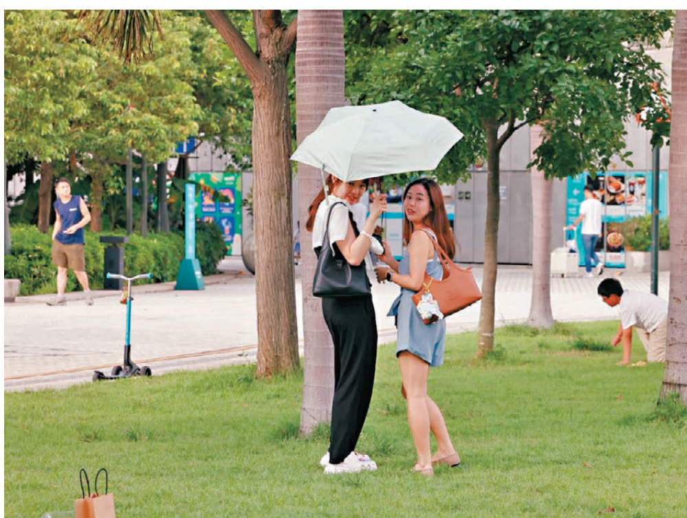
●天文台昨日發出今年首個酷熱天氣警告。

另外，僱員如出現熱疾病的症狀，例如頭痛、頭暈、口渴、噁心，應立即到陰涼處休息和飲水，並通知僱主或主管。勞工處發布的《預防工作中暑指引》，針對各風險因素建議相應的控制措施。