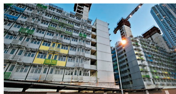
●簡約公屋周二開始接受第四期申請。圖為屯門欣寶路簡約公屋。

根據新加坡傳媒報道，新加坡戰備軍協俱樂部發表聲明說，保安公司已經報警，警方證實接獲報案，正調查案件。俱樂部表示，事發時旅遊巴士停泊在入口附近，阻礙其他駕駛入俱樂部的車輛，保安員履行職務時遭到言語辱罵。俱樂部強調，嚴肅看待任何針對執勤人員的辱罵行為。