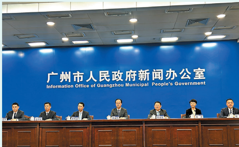
●廣州宣布啟動支持居民「賣舊買新」試點工作，收購300萬元以下、70平方米以下二手房。