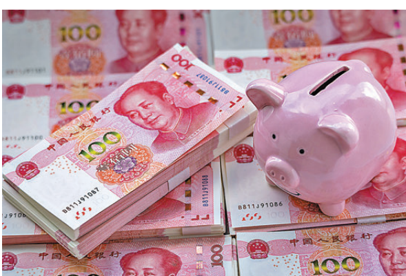
●麥格理認為，若中美利差維持在高位，人民幣會呈「被動升值」。 資料圖片

香港文匯報訊（記者 陳鍵行）投行麥格理最新報告指出，中國出口商及跨國企業自2022年以來已累積約6.24萬億港元（約8,000億美元）的人民幣套息交