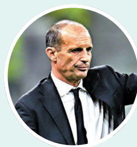
●AC米蘭證實辭退艾歷利。

另外，在意大利隊緣盡世界盃決賽後辭任主教練的加度素，落實在來季起執教拉素；至於今夏離開拉素的沙利，則會轉為執教阿特蘭大。