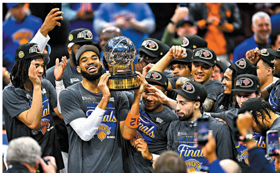
●紐約人球員在頒獎儀式上。