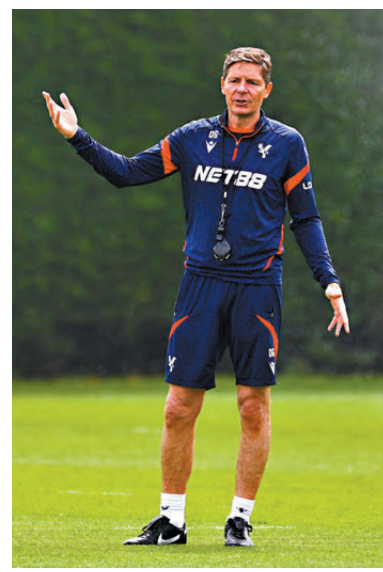
●加士拿將離開水晶宮。

定特別落力希望把冠軍獻給他們的主帥。在這情況下，我們必須保持冷靜，不要因為是決賽而作出改變，只要我們能維持上一圈淘汰斯特拉斯堡時的表現，一切便會輕鬆得多。」