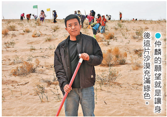
●仲麟的願望就是讓身後這片沙漠充滿綠色。

2022年，他開始小規模承包荒漠植樹；2023年，他一次性承包了200多畝荒漠。「當時就想，掙點錢就種一點，一個人慢慢種唄。」面對廣袤的沙海，一個人的力量終究有限。隨着短視頻的興