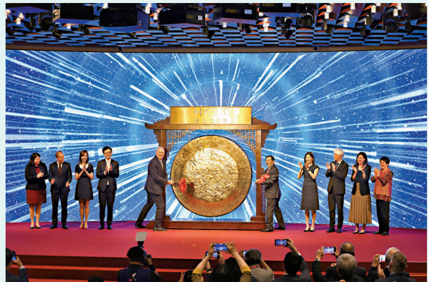
●港交所主席唐家成(右五)及國泰主席白德利(左五)等嘉賓昨主持敲鑼儀式。

港交所昨還宣布在交易廣場設立集團永久總部，並會與交易大堂一起升級，工程料於明年6月完成。港交所總法律顧問及集團首席可持續發展總監周冠英表示，總部改造後，會成為現代化、面向未來的辦公空間，成為切合香港資本市場核心基建和「超級聯繫人」定位的新地標。金融大會堂日後將設有全新的標誌性入口，並升級多媒體設施，設有更多會議空間，以提升上市發行人上市體驗，讓更多地方可以迎接發行人的嘉賓，來見證上市敲鑼儀式。