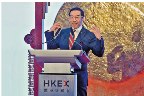
●港交所主席唐家成在午間敲鑼儀式致開幕辭。

作為香港國際金融中心的獨特地標，昨日是聯交所成立及交易大堂啟用40周年，為慶祝如此特別的日子，聯交所昨日邀請首家在聯交所上市的國泰航空(0293)，攜手舉行特別的午間敲鑼儀式。港交所(0388)主席唐家成指出，港交所在推動香港資本市場發展方面發揮重要作用，引領香港資本市場及互聯互通的發展，40年來港股自身實現了多個跨越式的發展，未來將繼續引領香港資本市場走向令人興奮的未來。