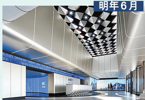
●交易大堂翻新模範圖。