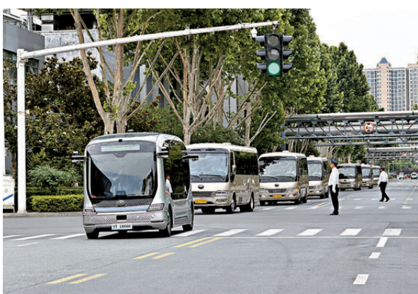
●採訪團一行走進鄭州宇通集團了解智能駕駛。

他表示，客車的意義，是把中國人載到世界各地，更重要的是把人帶回家。宇通客車駛向全球，也期盼