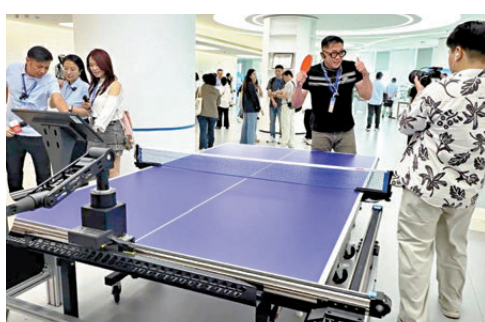
●媒體記者與機器人打乒乓球。

本次採訪活動由國務院台辦、中國記協共同組織，將持續至6月2日，兩岸媒體同行還將深入走訪河南多地，全方位展現中原文化底蘊與現代發展活力。