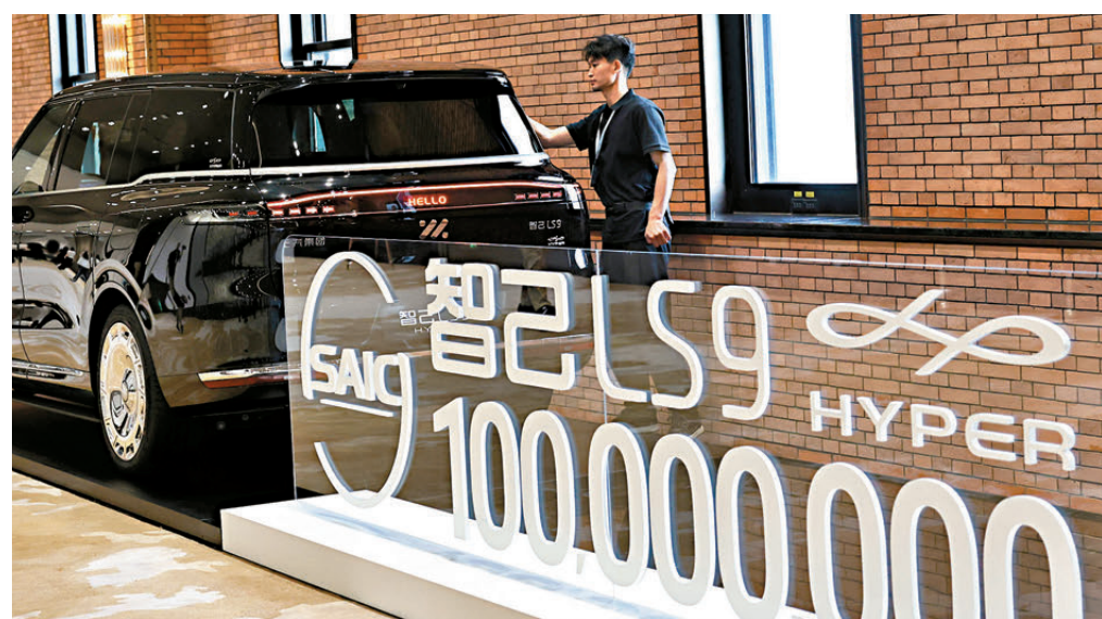
●5月28日，隨着第1億輛汽車在滬交付，上汽集團成為中國汽車工業史上首個累計產銷量突破1億輛的汽車集團。

新能源時代的核心競爭邏輯發生改變。軟件定義汽車、智能座艙、輔助駕駛以及電子電氣架構等新能力，正在成為全球車企競爭的新焦點。而中國企業在互聯網生態、消費電子產業以及數字化應用方面積累深厚，這使中國車企在智能化領域形成差異化優勢。例如，在歐洲市場，中國新能源汽車的智能座艙、語音交互、大屏體驗以及輔助駕駛功能，正受到越來越多年輕消費者關注，不少海外消費者對中國新能源汽車的認知，也開始從「便宜」轉向「科技感」。