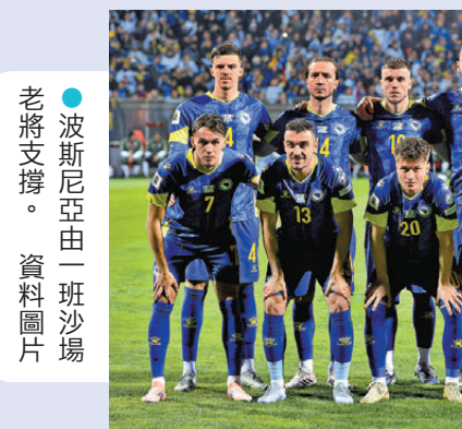
●波斯尼亞由一班沙場老將支撐。 資料圖片

巴斯能帶來驚喜，這位波斯尼亞主帥在球員時代曾效力多蒙特及利華古遜等著名球隊，值得一提的是他退役後曾轉戰撲克界，更成為活躍於巡迴賽的職業高手。兩年前首執教鞭的巴巴斯上任後積極尋找流散海外的球員，首份國家隊名單竟有多達17人在海外出生，當中有12人曾為其他國家青年隊上陣，最終成功率隊爆冷淘汰威爾斯及意大利打入決賽周。他不拘一格、靈活多變的作風，或會成為波斯尼亞爭取更上一層樓的關鍵。