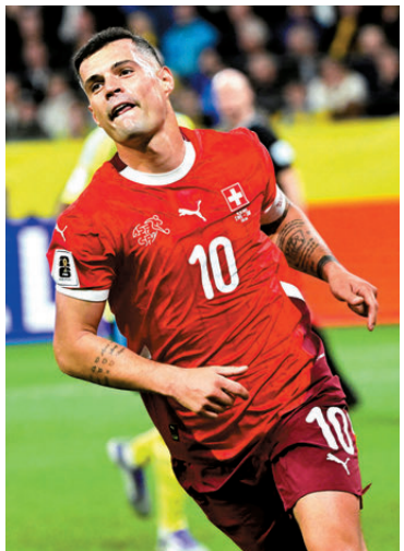
●格列沙加仍是瑞士中場核心。

而20歲天才中場文森比的冒起亦令主帥耶堅更有信心衝擊更高目標，這德甲「新人王」不僅擁有出色的盤帶能力，更以防守及搶截能力見稱，吸引歐洲豪門如曼聯垂青，加上中堅文路爾艾簡治及門將基哥高保等大賽經驗豐富的球員，前中後三線平均的瑞士絕對是世界盃「黑馬」之一。