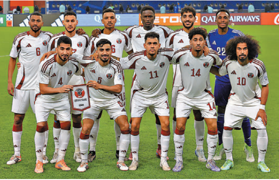
●卡塔爾以傳控風格抗衡列強。 資料圖片

卡塔爾去年聘請曾帶領皇家馬德里的盧柏迪古擔任主帥，強調地面傳控及防守組織，更為符合亞洲球員的特點。現年29歲的阿菲夫仍是球隊的絕對核心，這名前鋒在外圍賽射入四球並有10個助攻，更破紀錄六度當選卡塔爾聯賽最佳球員。不過卡塔爾同組對手加拿大、瑞士及波斯尼亞均是擅長身體對抗的球隊，球隊防線面對死球及高空攻勢將受考驗。