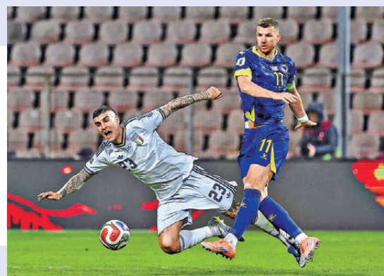
●年屆40歲的迪斯高(右)，仍是波斯尼亞鋒線支柱。