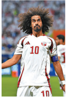
●阿菲夫擔任卡塔爾領軍人物。