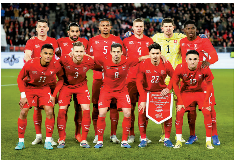
●瑞士攻守兼備，勢成今屆世界盃一大「黑馬」。 資料圖片

香港文匯報訊(記者 郭正謙)世界排名第19位的瑞士被視為今屆世界盃其中一匹「黑馬」，外圍賽以不敗成績躋身世界盃，瑞士陣中雖然沒有頂尖球星坐鎮，不過球隊極具紀律性的機動性踢法仍令列強聞風喪膽，除了中場大將格列沙加依然保持良好狀態，比列安保路及諾亞奧卡科一對「瑞士尖刀」亦是球隊殺着，憑藉攻守兼備的陣容，在B組首名晉級呼聲最高。