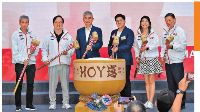
HOY 媒體網絡全港獨家直播第二十屆亞運會啟動禮昨日舉行。