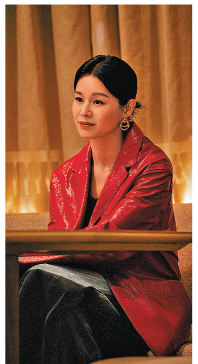
胡杏兒自言扮演女演員是本色演出。