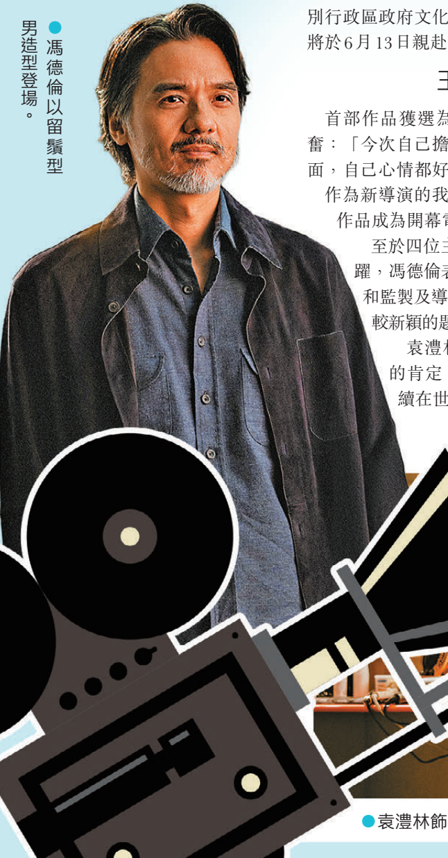
馮德倫以留鬚型男造型登場。

由爾冬陞監製，香港新銳導演王德健自編自導，馮德倫、袁澧林、胡杏兒及周秀娜領銜主演的電影《第四幕》，獲選為第28屆上海國際電影節（簡稱上影節）開幕電影。上影節方面表示，《第四幕》獲選為開幕電影，除了因為它展示出一部新人長片首作的藝術勇氣，更有電影代際傳承與創作活化的意義。 ●香港文匯報記者 余雁