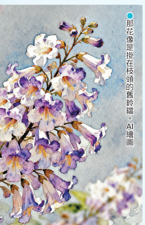
● 那花像是掛在枝頭的舊鈴鐺。AI 繪圖

那年我高考失利，整個人像被抽了筋骨，終日蜷在房間裏，對着牆壁發呆。窗外的泡桐正開得如火如荼，淡紫色的花影透過窗格，投在書桌的稿紙上，斑駁得像誰打翻了顏料。我煩躁地把稿紙揉成一團，扔向牆角。母親推門進來，沒說話，只是默默地撿起紙團，撫平了，放在桌上。她轉身走到窗邊，推開那扇吱呀作響的木窗，一股帶着泥土和花香的風便湧了進來。她伸手折