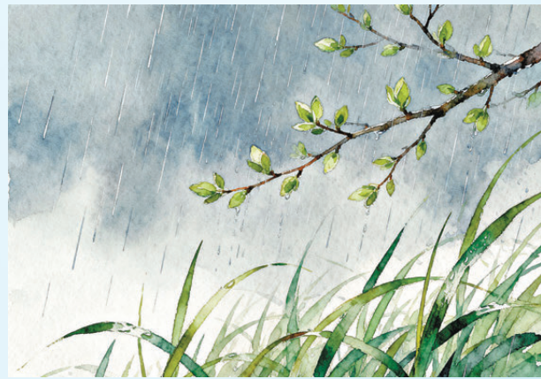
● 珍貴的從不是春雨本身。