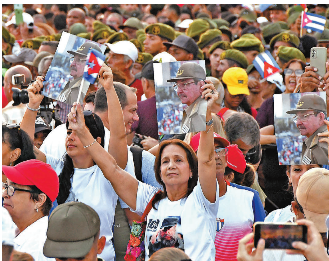
●古巴民眾不滿美國指控勞爾·卡斯特羅謀殺，上街集會抗議。