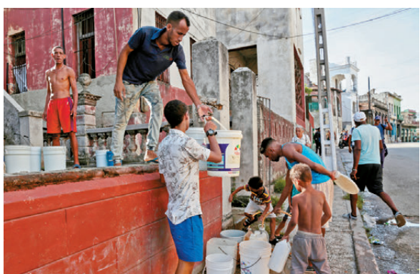
●美國對古巴進行石油封鎖，令當地民眾生活苦不堪言。

德科西奧還批評，美國部分政客鼓吹對古巴開戰，試圖將古巴塑造成威脅，以此為軍事行動製造借口。他質問軍事行動勢必導致古巴人和美國人傷亡：「美國政府將如何說服本國民眾，讓他們相信，僅僅為了滿足一小撮在華盛頓擁有影響力、能夠影響政客的富裕精英集團的野心，就給一個鄰國帶來死亡、破壞和苦難，是符合他們自身利益的？」