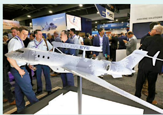
●「全球之眼」預警機在加拿大展出。

加拿大當局早前表示，當前國際環境下，美國已不再和過去一樣可靠，加方願意與北歐國家，在北極防衛及其他議題上加強合作。