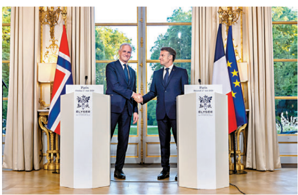
●馬克龍(右)與斯特勒在聯合記者會握手。

斯德哥爾摩國際和平研究所及美國科學家聯會最新數據，法國估計擁有約290枚核彈頭，其中逾八成由潛艇發射。