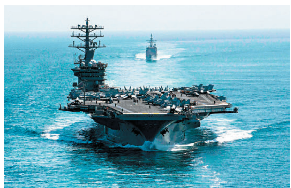
●「尼米茲」號航母打擊群本月進入加勒比海。資料圖片

坎西恩估計，該航母連同部署在佛羅里達州和美屬波多黎各的美軍戰鬥機，很可能在針對古巴的軍事行動中發揮作用。他預計美軍空襲可能用於摧毀古巴防空系統，為規模更大的空中行動開路，甚至可能仿效美軍在伊朗衝突的做法，直接襲擊古巴領導層，日前被美方無端起訴的古巴革命領袖勞爾