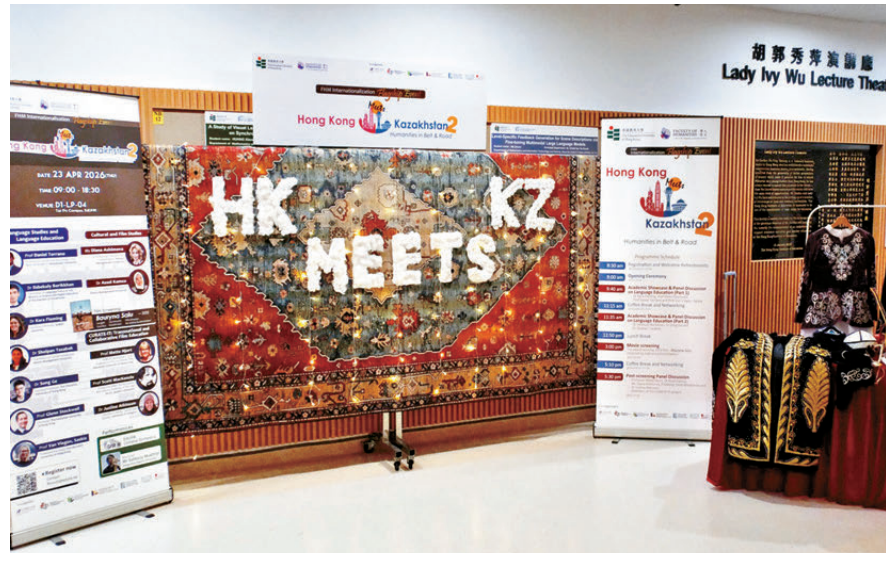
●教大早前在校內舉辦「香港遇見哈薩克斯坦」活動。