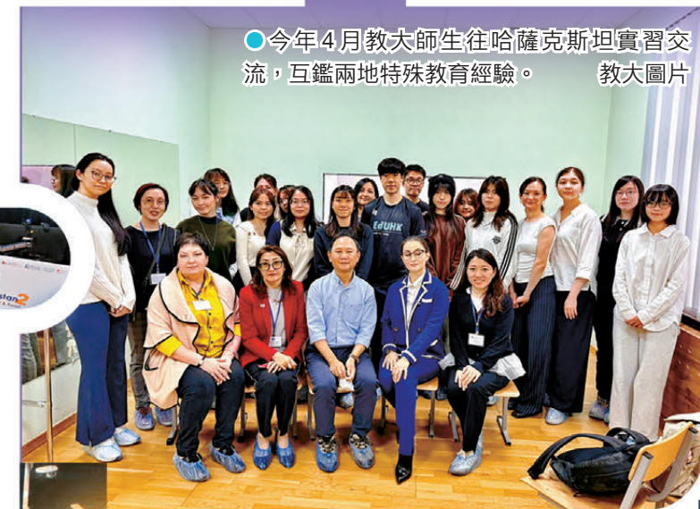
●今年4月教大師生往哈薩克斯坦實習交流，互鑑兩地特殊教育經驗。