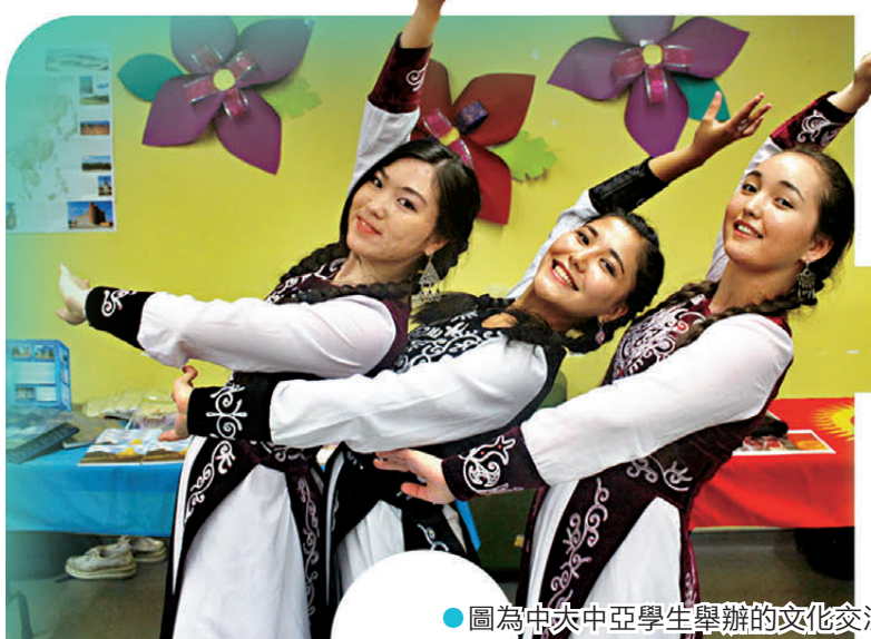
●圖為中亞中亞學生舉辦的文化交流活動。

據其觀察，四年前在哈薩克斯坦了解香港高等教育的人不多，「要主動去查，才能找到資訊，但最近兩三年，香港已經成了學生出國留學的熱門選擇。」今年他回國時重回高中母校，「學生大多都知道香港是留學的好地方，身邊很多人今年都考上了教大或其他香港的大學。在學生群體裏，香港留學已經很火了。」