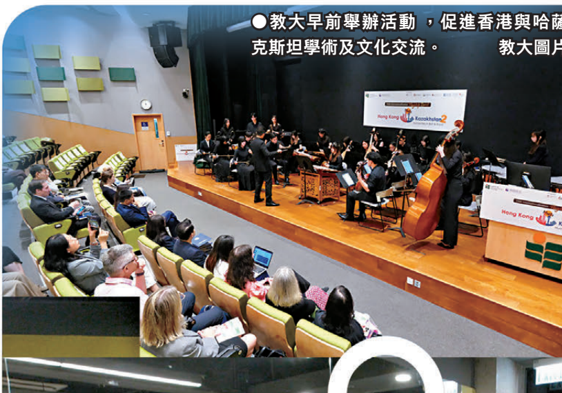
●教大早前舉辦活動，促進香港與哈薩克斯坦學術及文化交流。

她認為香港與哈薩克斯坦有着相似的價值觀，例如很重視文化和家庭聯繫，「相信香港與中亞之間，無論在經濟還是文化上都有着巨大的合作潛力。」故她對特區政府今次組團訪問中亞，寄望甚殷。