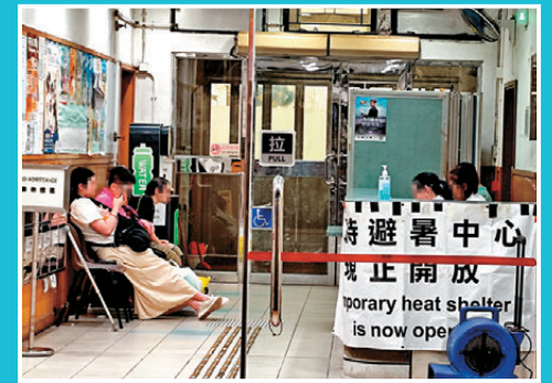
●梁顯利油麻地社區中心晚上開放臨時避暑中心。