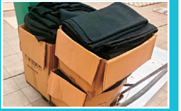
●臨時避暑中心準備的被子。