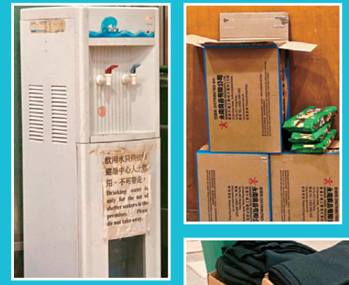
●臨時避暑中心內的飲水機，讓入住市民可飲水或煮即食麵。