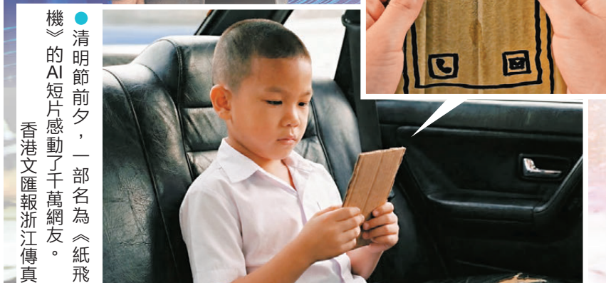
●清明節前夕，一部名為《紙飛機》的AI短片感動了千萬網友。