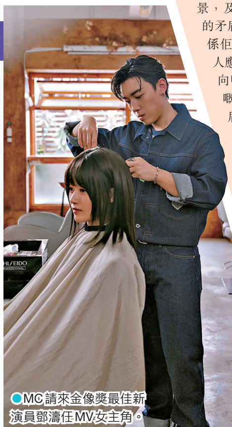
●MC 請來金像獎最佳新演員鄧濤任MV女主角。