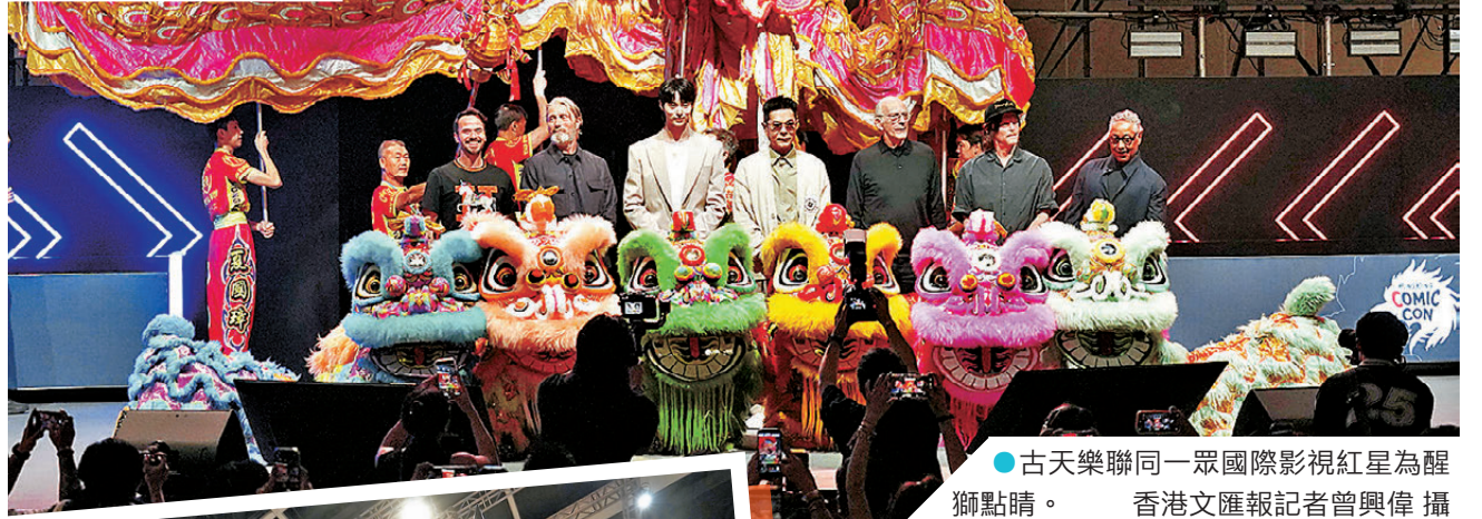
●古天樂聯同一眾國際影視紅星為醒獅點睛。