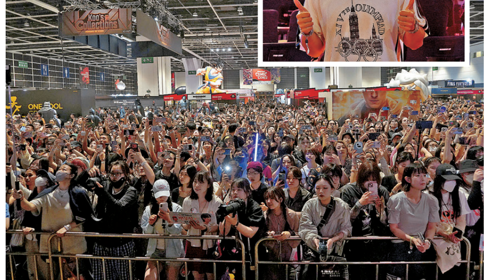
●現場充滿動漫迷及藝人粉絲圍觀。

劃，他透露會炮製以鍾馗捉鬼為藍本的漫畫《斬魔君鍾馗》，更由古裝去到時裝，鍾馗在捉鬼時會結合現代科技，角色人物也必須適應新世界，並會拍成動畫和真人版，他指現在製作漫畫比拍電影自由度更大更寬闊。而他是流行文化代表之一，談到對發展 IP 產業前景的看法，他認為：「創造一個 IP 成功才謂之 IP，現在科技可利用 AI 配合，今次鍾馗的構思都會運用到 AI 創作。」他認為現在有 AI 技術輔助，可以將製作漫畫的時間縮減，創作出更多故事去拍成動畫。提到他親自演出鍾馗的漫畫真人版，但相傳鍾馗外形滿臉鬚鬚，他笑說：「我就要等三四年長滿鬚鬚去拍！」