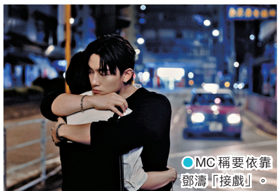
●MC 稱要依靠鄧濤「接戲」。

MC 將於 7 月舉行第二次紅館演唱會，公開發售不久門票已售罄，一票難求。MC 很感激樂迷支持，今次是他第一次舉行連續 5 天的演唱會，內容需要高強度的體力和聲音應付，跟公司溝通過後決定專注做好這 5 場演出，答謝一直支持他的樂迷。