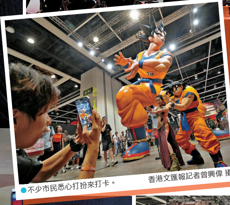
●不少市民悉心打扮來打卡。