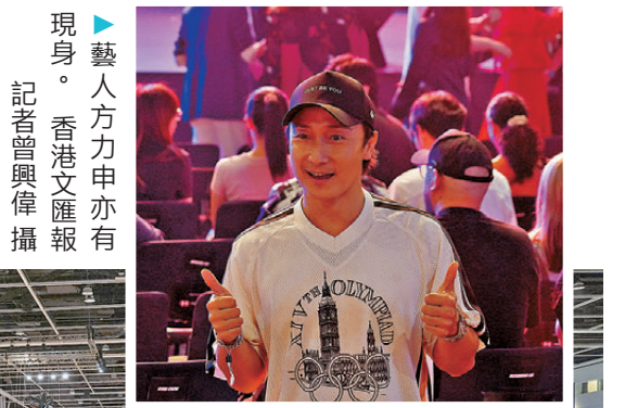
●藝人方力申亦有現身。