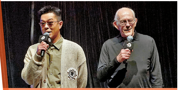
●Christopher Lloyd 由古天樂陪同上台。