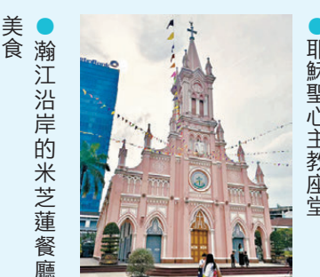
●瀚江沿岸的米芝蓮餐廳