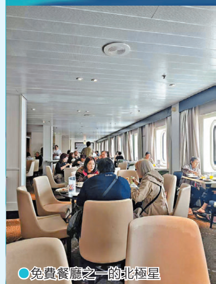
●免費餐廳之一的北極星