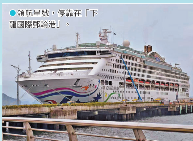
●領航星號，停靠在「下龍國際郵輪港」。

郵輪遊，常被誤解為老年人的「養老式度假」，只是隨海漂流，岸上遊玩的時間有限，因此顯得無聊——其實這只是許多人的錯誤印象。郵輪上的活動十分豐富，還有大量美食任君挑選；想休息時休息，想緊湊時緊湊，與爭分奪秒的個人旅行截然不同，這是一段非一般的旅程。這次我們踏上領航星號，前往下龍灣與峴港，探索不一樣的越南，既能享受船上的悠閒氛圍，又能在停靠時感受越南的自然與文化，讓旅程既舒心又充滿驚喜。 ●文·攝：雨燕