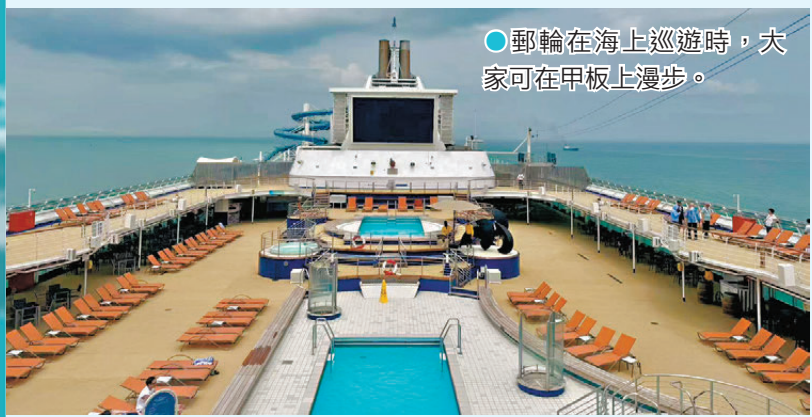
●郵輪在海上巡遊時，大家可在甲板上漫步。

在郵輪上，我們不用趕行程，不用做攻略，睡到自然醒，推開窗就是大海。美食、娛樂、休閒一站式滿足，並享受三餐不重樣的美食。如果是內艙房及海景房，我們可以免費享用三家餐廳，分別為中餐的北極星、西餐的索非亞、還有最大的自助餐廳都餐廳。如果你手上的是「金卡」，恭喜你，將享有更多免費餐廳選擇。吃飽美食，可以走到甲板上迎着海風漫步，觀看日出日落時分的絕美海景。船上除了免費餐廳，大多服務或餐飲美食都要收費，相對在香港價錢會高一點。