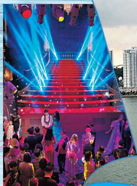
●旅客被邀請到舞池跳舞。