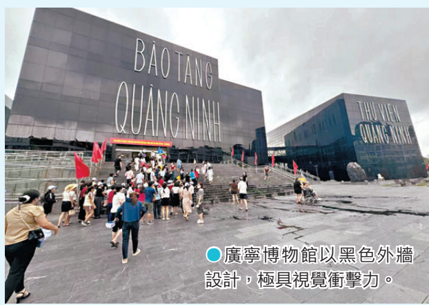
●廣寧博物館以黑色外牆設計，極具視覺衝擊力。

隨着國人走遍世界，小紅書查找美食極方便，這次小編就在小紅書中找到兩家餐廳，一家吃海鮮粉，120,000越南盾（約33港元）吃含瀨尿蝦肉、蟹肉及蜆肉的海鮮大盛匯，絕對是海鮮粉絲最愛；另一間則為獲多人讚好的越南河粉，一碗60,000越南盾（約18港元），對比香港動輒50-60港元的越南河粉，簡直不要太幸福！而且無論湯味還是配料，相對香港餐廳都是壓倒性地好吃。