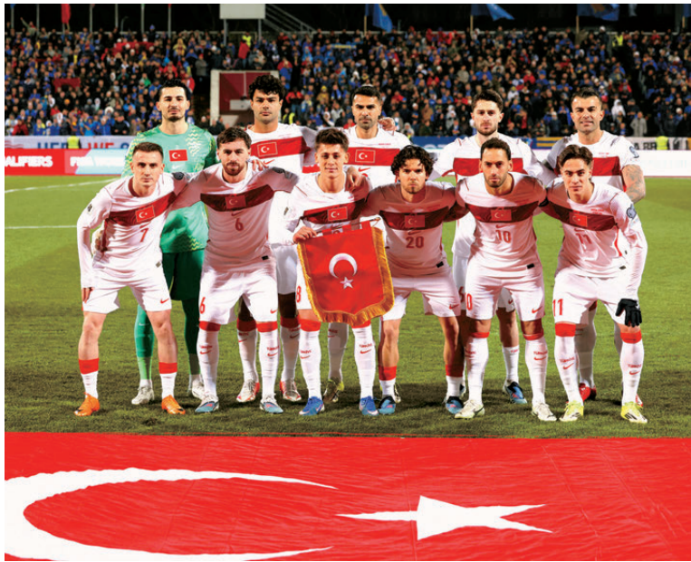
●土耳其闊別24年重返世界盃舞台。資料圖片

香港文匯報訊(記者 葉詩敏)時隔24年再度躋身世界盃決賽周的土耳其，在歐洲區附加賽接連淘汰羅馬尼亞與科索沃後，這支「星月軍團」挾黑馬姿態力爭在D組突圍而出，甚至衝擊淘汰賽更遠階段。