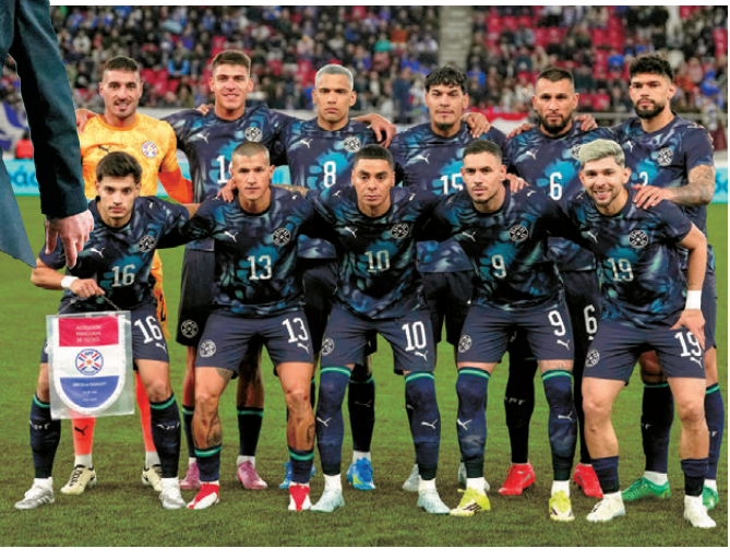
●巴拉圭防守穩健，但入球板斧欠奉。資料圖片