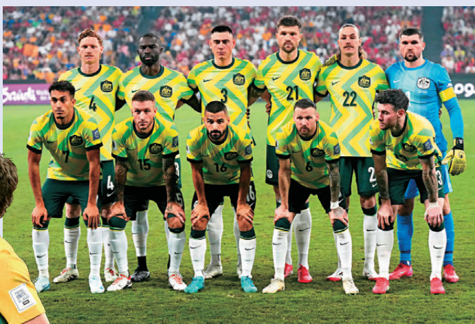
●澳洲攻守兼備，或有力締造驚喜。資料圖片 貝基斯及帕爾馬中堅施卡堤組成的三中堅防線，無疑是袋鼠軍團最讓人安心的基石。