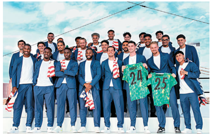
●美國陣容平衡，惟技術與創造力不足。資料圖片

不過後防缺乏具備能力的年輕球員亦是球隊隱憂，主力中堅添列姆已屆38歲「高齡」，至於效力水晶宮的基斯察士速度亦偏慢，或會成為被對手利用的弱點。而三位門將馬特端納、馬特費斯與基斯巴迪均來自美職聯，正選門將馬特端納的實力並不屬於頂尖，也成為美國其中一大軟肋。