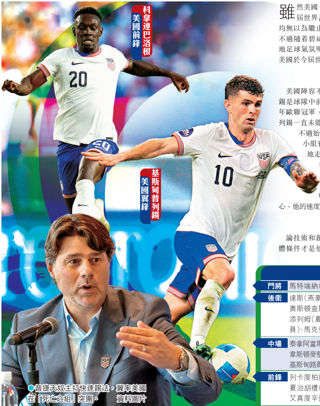
科拿連巴洛根 美國前鋒