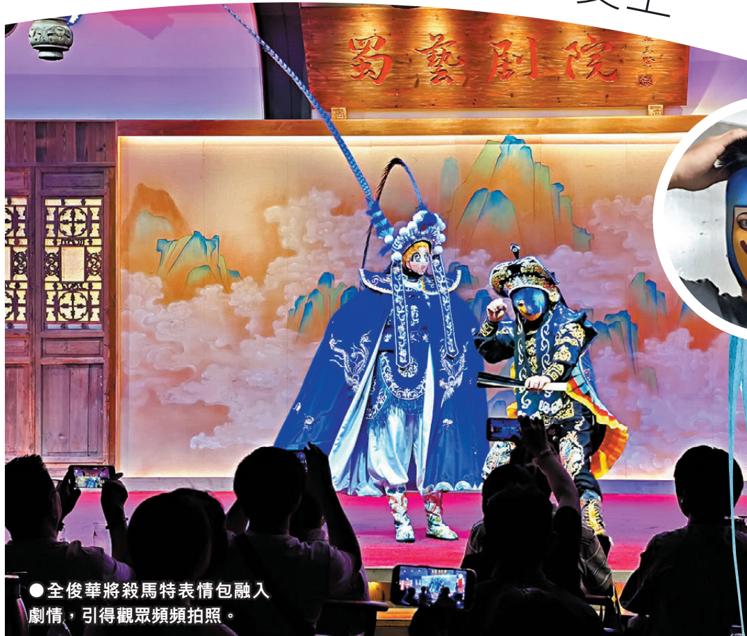
●全俊華將殺馬特表情包融入劇情，引得觀眾頻頻拍照。