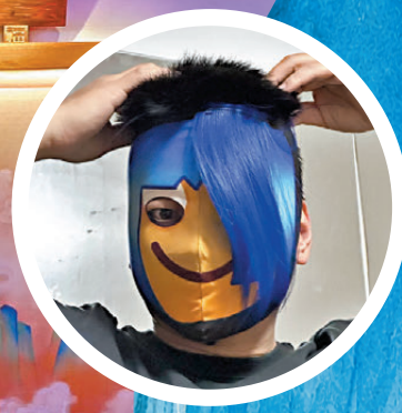
▲加上藍色劉海的臉譜從平面變為立體。