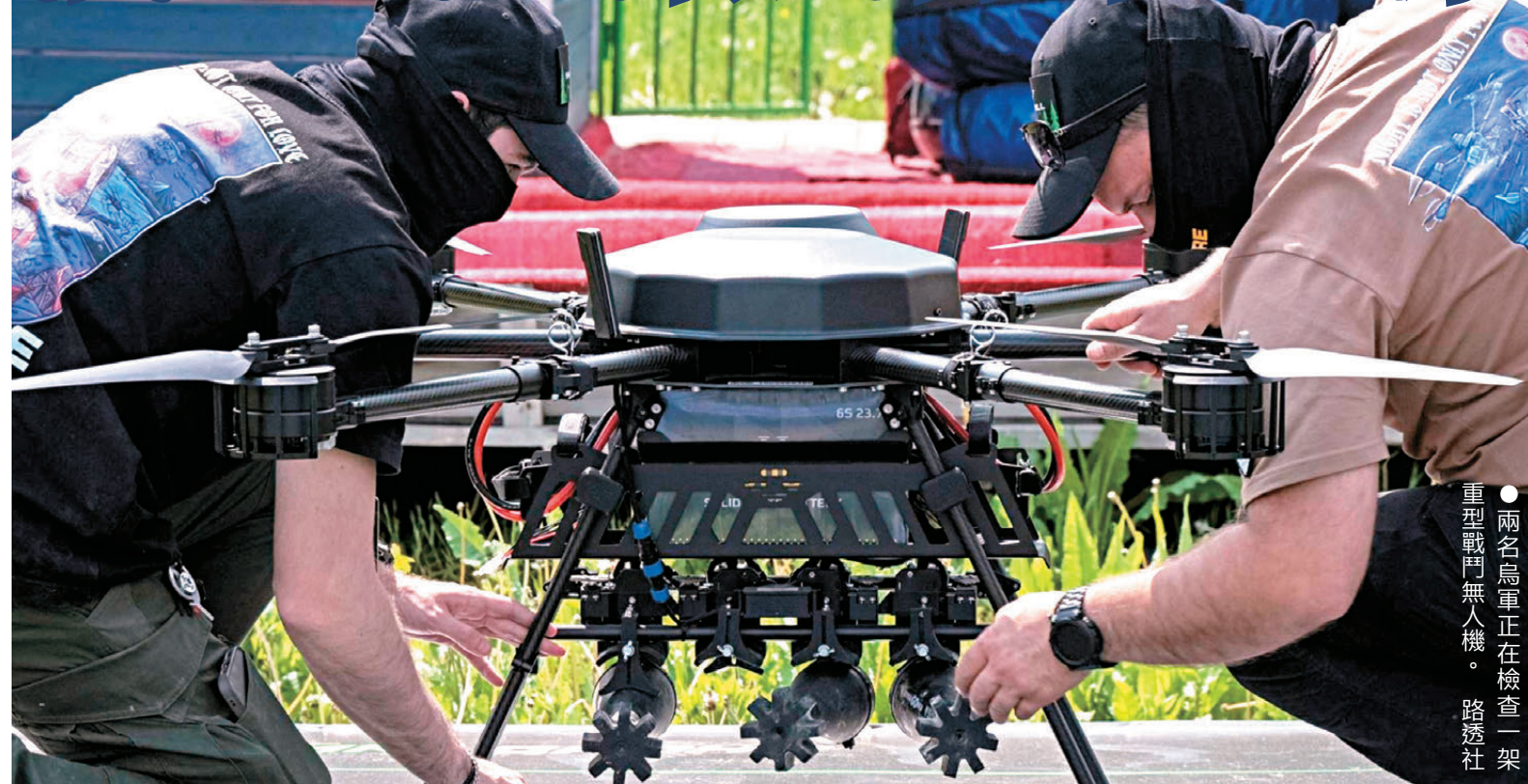
●兩名烏軍正在檢查一架重型戰鬥無人機。