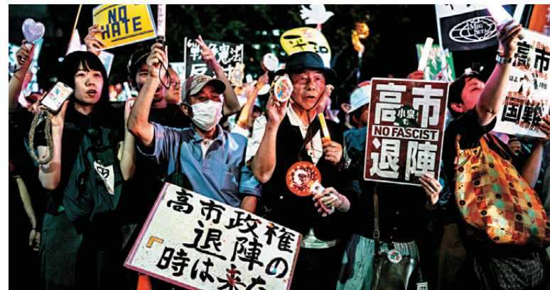
●日本民眾手持標語，參加國會議事堂前的抗議集會。

香港文匯報訊 約1萬名日本民眾29日晚在位於日本東京的國會議事堂前舉行反戰集會，抗議高市早苗政府的一系列危險政策動向。集會主題為「不讓戰爭發生」。在集會現場，抗議者手舉「反對出