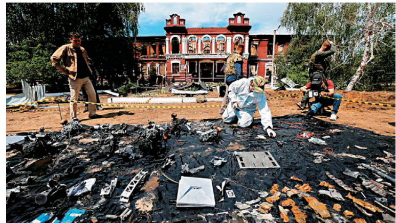
●烏軍使用無人機襲擊盧甘斯克地區一所學校。

香港文匯報訊 據今日俄羅斯通訊社29日援引俄總統普京稱，從特別軍事行動戰場形勢來看，有理由認為俄烏衝突臨近收尾，但在交戰持續的現狀下，無法劃定俄烏衝突的具體結束時限。